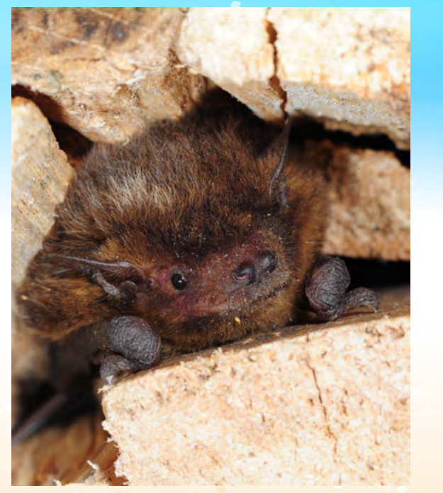
Diese Rauhauffledermaus versteckt sich in einem Holzstapel. Aufgrund der steigenden Temperaturen dehnt sich ihr Verbreitungsgebiet in Europa nach Norden aus.

Viele der nötigen Maßnahmen seien technisch nicht kompliziert, betont der Fledermausforscher – sie müssten nur gewollt und konsequent umgesetzt werden. Sascha Buchholz ergänzt: „Da ein klarer politischer Wille zur Veränderung fehlt, bin ich nicht sonderlich optimistisch. Aber hoffnungsvoll bleibe ich – sonst wäre ich kein Ökologe.“