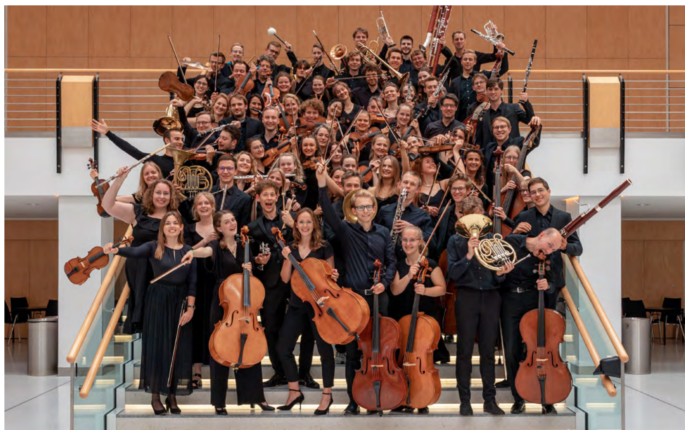
Etwa 90 Musikerinnen und Musiker, größtenteils Studierende der Universität, aber auch der Musikhochschule, sowie Berufstätige erarbeiten jedes Semester gemeinsam ein sinfonisches Programm. Die Proben finden donnerstags abends in der Aasee-Aula statt.