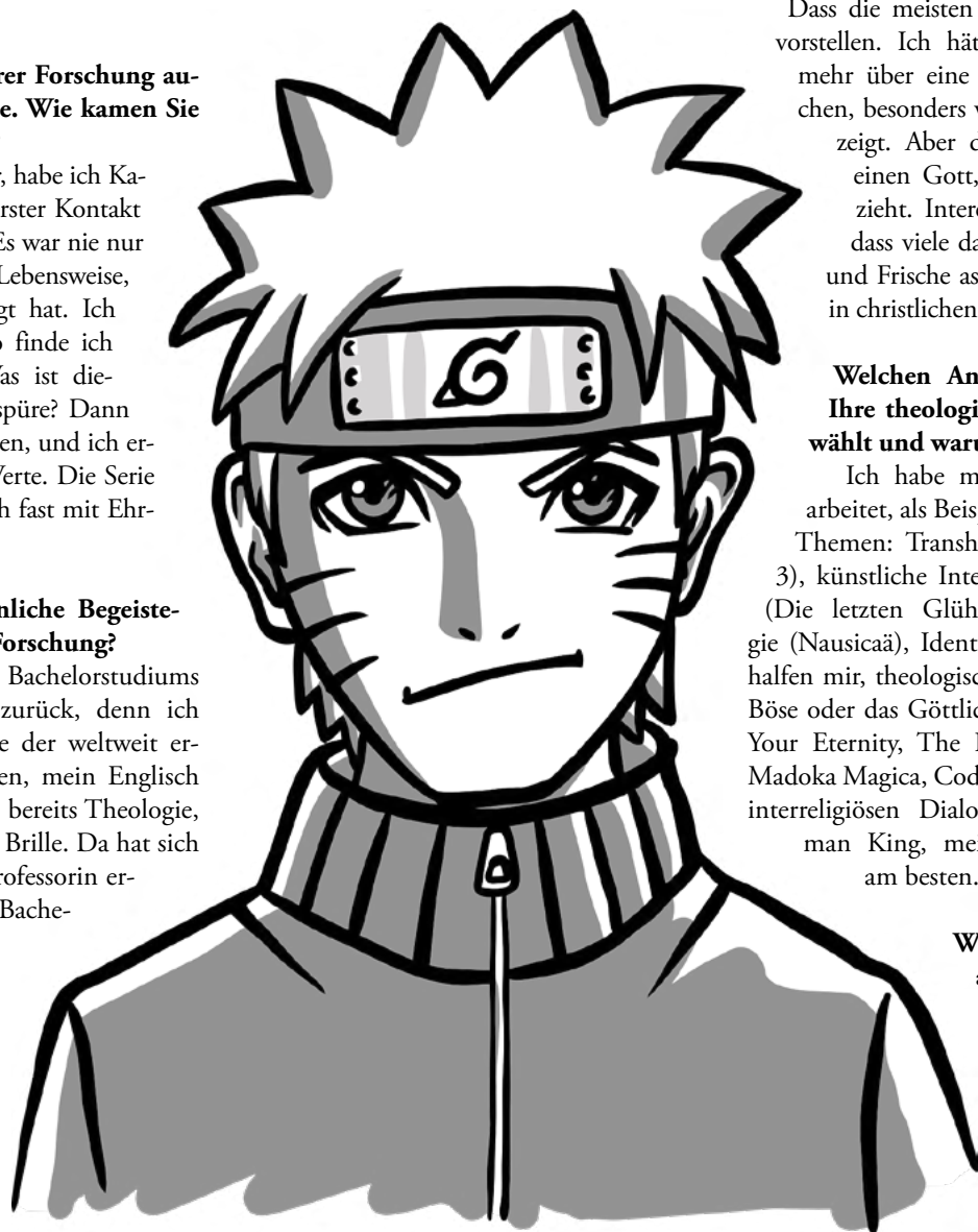
Naruto – hier ein Abbild der namensgebenden Titelfigur – zählt zu den erfolgreichsten Animeserien weltweit.

Ich hoffe, dass meine Erkenntnisse Einfluss in die Praxis finden, zum Beispiel in der theologischen Lehre, und dass sie zu weiterer Forschung anregen. Ich möchte gerne in der Wissenschaft bleiben. Ich liebe Forschung und möchte Anime und Videospiele in der Lehre einsetzen.