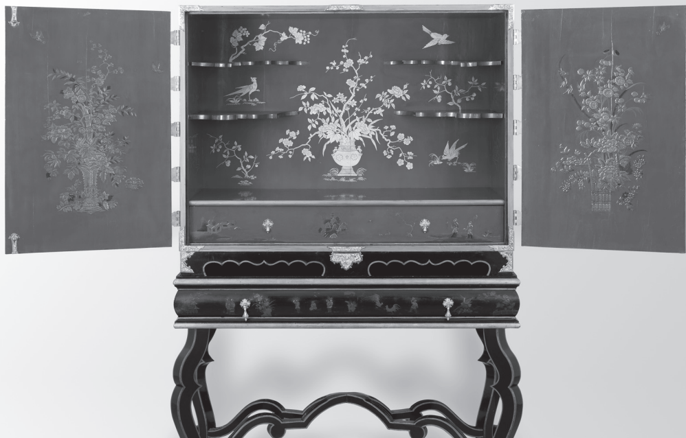
Kabinettsschrank Deutschland (Dresden) um 1715, Werkstatt Martin Schnell (um 1675–1740), Hoflackierer Augusts des Starken Erworben 2006 mit Unterstützung der Kulturstiftung der Länder und des Freundeskreises