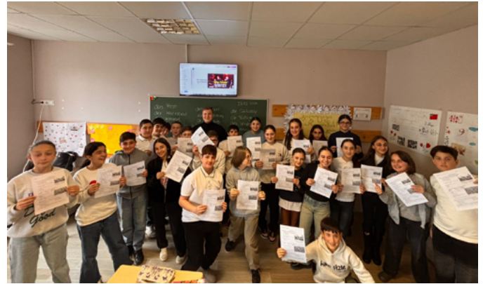
Die Freude der georgischen Schülerinnen am Thema „Karneval“ ist deutlich zu erkennen.

In Kutaissi wurden die Studierenden während der ersten Hälfte des Praktikums an zwei staatlichen Schulen eingesetzt. Hier stand die eigenständige Gestaltung von Unterrichtsstunden im Vordergrund der Tätigkeit. Die Themen orientierten sich entweder an den jeweiligen Unterrichtsreihen oder griffen kulturelle Aspekte wie Karneval, Ostern oder den Umweltschutz in Deutschland auf. Die Stunden fanden überwiegend in verschiedenen sechsten Klassen statt, die Freude der Schüler:innen am Unterricht sowie die Zusammenarbeit mit den DaF-Lehrkräften vor Ort waren eine große Bereicherung. Gegen Ende der Schulphase wirkten die Studierenden außerdem gemeinsam mit der Universität Kutaissi an einem „Tag der europäischen Autoren“ mit. Dabei präsentierten Schüler:innen verschiedener Altersstufen ihnen bekannte europäische Autoren auf Deutsch. Auch hier beeindruckte das sprachliche Niveau der Präsentationen sowie die festliche Gestaltung des gesamten Tages.