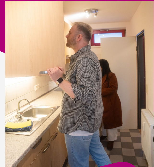
Uni MS – Emka Photography

Die Suche nach Wohnungen ist auf verschiedenen Websites kostenlos. Einige Immobilien werden möglicherweise von Maklern angeboten, die bei erfolgreicher Vermittlung eine Provision erhalten.