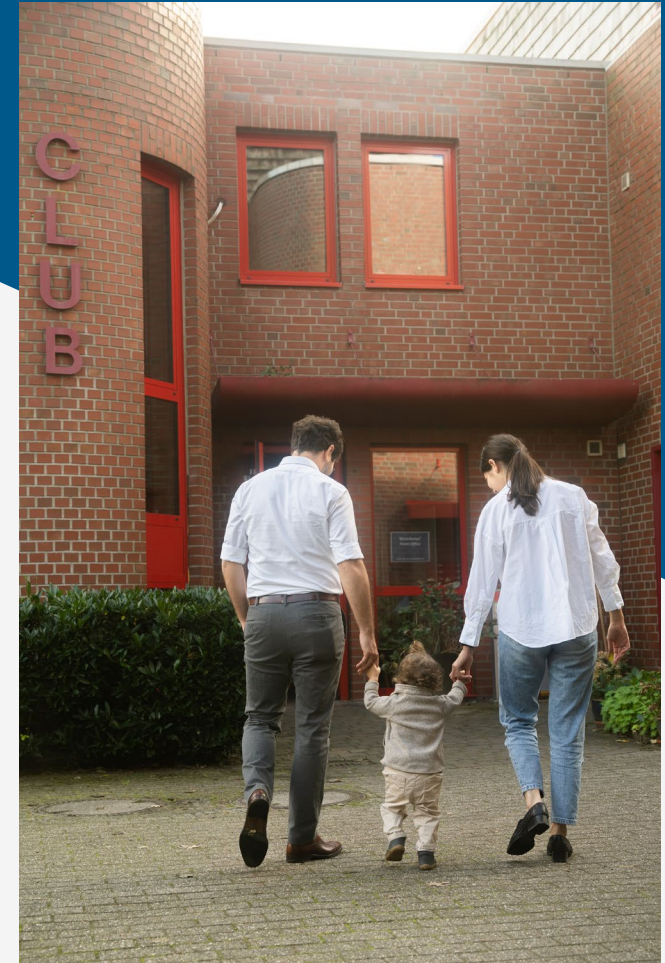
Uni MS – Emka Photography

Dafür müssen sowohl der betreuende Elternteil als auch Ihr Kind bei der gesetzlichen Krankenkasse versichert sein. Sofern diese Voraussetzungen erfüllt sind, besteht ein Anspruch auf eine Freistellung für 10 Arbeitstage im Jahr für jedes Kind. Bei mindestens drei Kindern hat jedes Elternteil die Möglichkeit, sich 25 Tage im Jahr freistellen zu lassen. Für alleinerziehende Eltern und wenn beide Eltern arbeiten gilt jeweils die doppelte Zeitdauer (20/50 Tage).