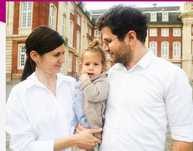
Uni MS – Emka Photography

Für jüngere Kinder bieten die Stadt Münster und auch das Servicebüro Familie der Universität Münster umfangreiche, teilweise ganztägige Ferienprogramme an. Darüber hinaus gibt es in Münster eine Vielzahl von Spielplätzen, Parks, Schwimmbädern und. Auch die verschiedenen Museen, Kinos, Theater und Zoos oder Vereine bieten besondere Kinderprogramme an.