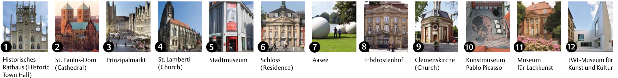
1 Historisches Rathaus (Historic Town Hall) 2 St. Paulus-Dom (Cathedral) 3 Prinzipalmarkt 4 St. Lamberti (Church) 5 Stadtmuseum 6 Schloss (Residence) 7 Aasee 8 Erbdrostenhof 9 Clemenskirche (Church) 10 Kunstmuseum Pablo Picasso 11 Museum für Lackkunst 12 LWL-Museum für Kunst und Kultur