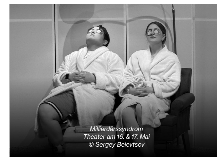
Milliardärssyndrom Theater am 16. & 17. Mai