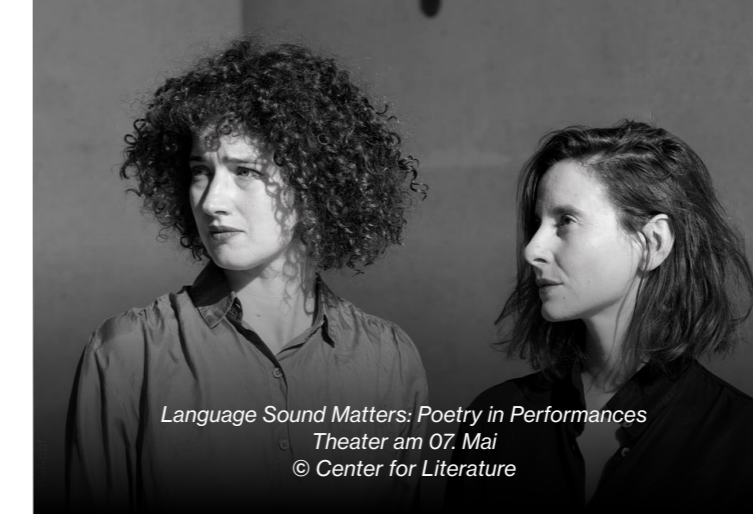
Language Sound Matters: Poetry in Performances Theater am 07. Mai