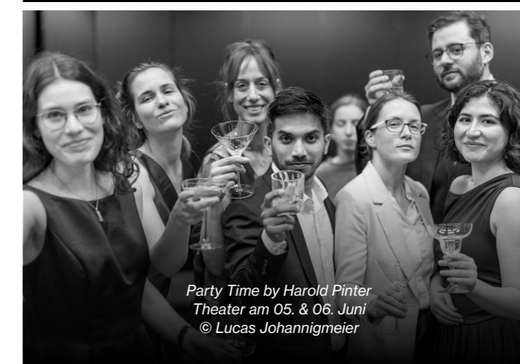
Party Time by Harold Pinter Theater am 05. & 06. Juni