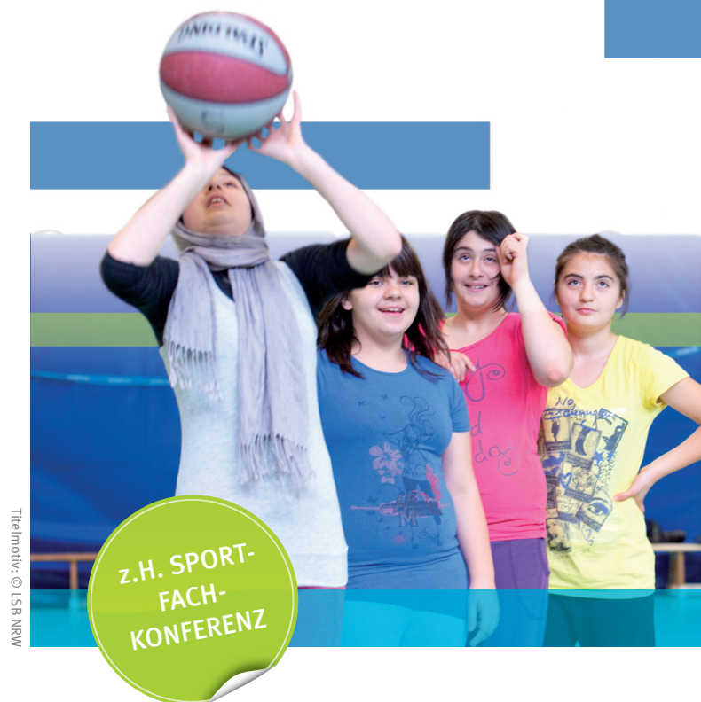
Tiefmotive: © LSB NRW

sport.lernen FORTBILDUNGSPROGRAMM DES INSTITUTS FÜR SPORTWISSENSCHAFT 2012/2013 Zertifikatslehrgänge und Seminare