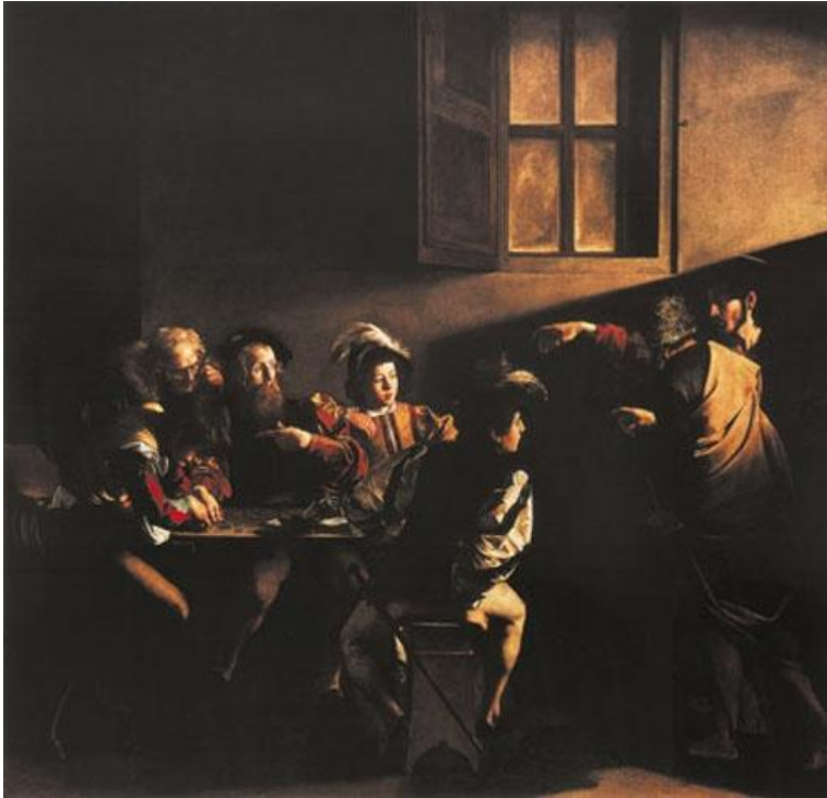
Bild für den Roman ist so maßgeblich, dass es im Buch in Schwarzweiß reproduziert ist (vgl. 198) und ein Ausschnitt des Gemäldes, das Gesicht Salvatores, des Erlösers, auch für den Schutzumschlag verwendet wurde.