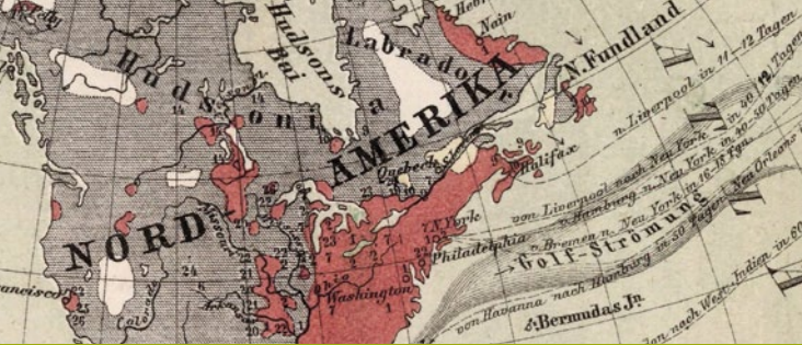
Weltkarte der Mission, mit Angabe der Verbreitung der Hauptreligionen über die Erde, 1859