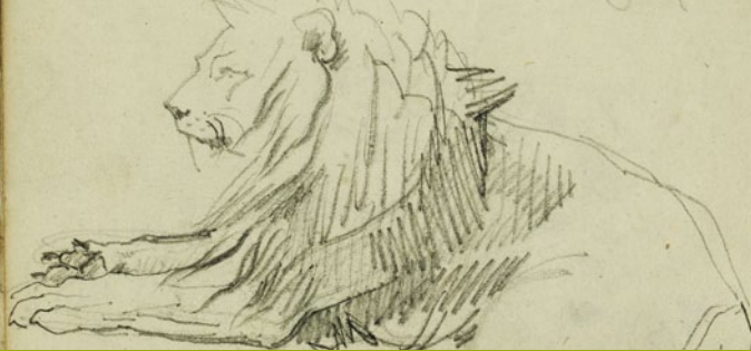
Philosoph Hans Blumenberg hat auch anekdotische Betrachtungen über das Motiv des Löwen angestellt. Schriftstellerin Sibylle Lewitscharoff greift dieses Motiv in ihrem Roman „Blumenberg“ auf. (Seated lion, Théodore Géricault, 1812–1814)