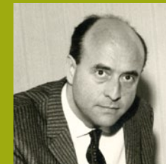
Hans Blumenberg – Namensgeber der neuen Gastprofessur

Der renommierte Münsteraner Philosoph Hans Blumenberg (1920–1996) war von 1970 bis zu seiner Emeritierung 1985 Professor an der Universität Münster. Mit seinen Studien trug er wesentlich zur Neubestimmung des Ortes der Neuzeit in der geschichtswissenschaftlichen und philosophischen Diskussion bei. Er stellte die damals vorherrschende Säkularisierungsthese in Frage, nach der theologische Deutungsmuster aus dem Mittelalter über den Umbruch zur Neuzeit hinweg im modernen Staat fortwirken. In „Die Legitimität der Neuzeit“ plädiert Blumenberg dafür, die Entstehung der Neuzeit als Akt der humanen Selbstbehauptung gegen die theologischen Absolutheitsansprüche spätmittelalterlichen Denkens zu interpretieren. Der Philosoph befasste sich in seinen begriffs-, geistes- und philosophiegeschichtlichen sowie anthropologischen Studien auch mit der Interpretation von Mythen und Metaphern.