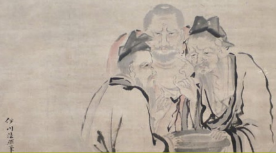
Kanō Isen'in „Die drei Essigverkoster“, ca. 1802–1816