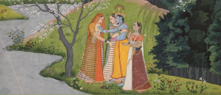
Krishna in der Brautmystik der Dichterin Mirabai