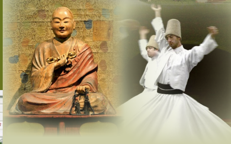
Bildnachweise: Krishna in der Brautmystik der Dichterin Mirabai (Museum Rietberg, Dauerleihgabe Barbara und Eberhard Fischer, Foto: Rainer Wolfsberger); Sema-Zeremonie des Derwischordens in Awanos, Türkei (wikipedia/Schorie); Sitzender Kukai-Buddha (Museum Rietberg, Foto: Rainer Wolfsberger); Vince Musil/The White House