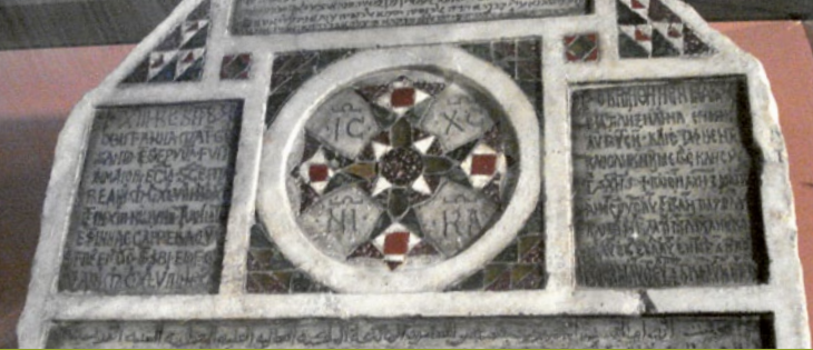
Grabstein für Anna, Mutter des Priesters Grisandus (Palermo, 1149)