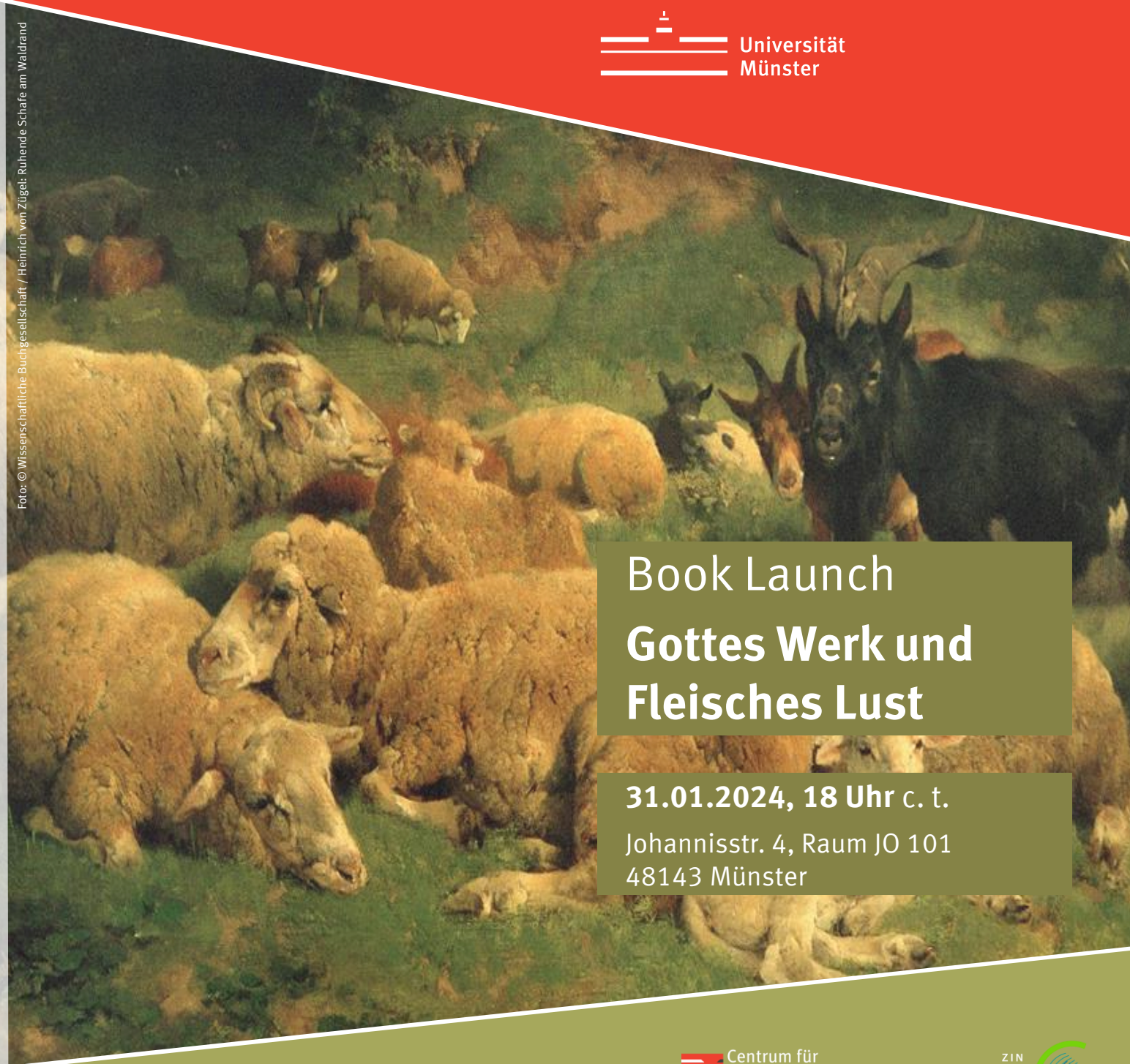
Foto: © Wissenschaftliche Buchgesellschaft / Heinrich von Zügel: Ruhende Schafe am Waldrand