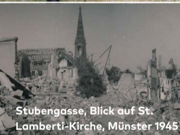
Stübgasse, Blick auf St. Lamberti-Kirche, Münster 1945