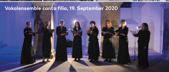
Vokalensemble canta filia, 19. September 2020