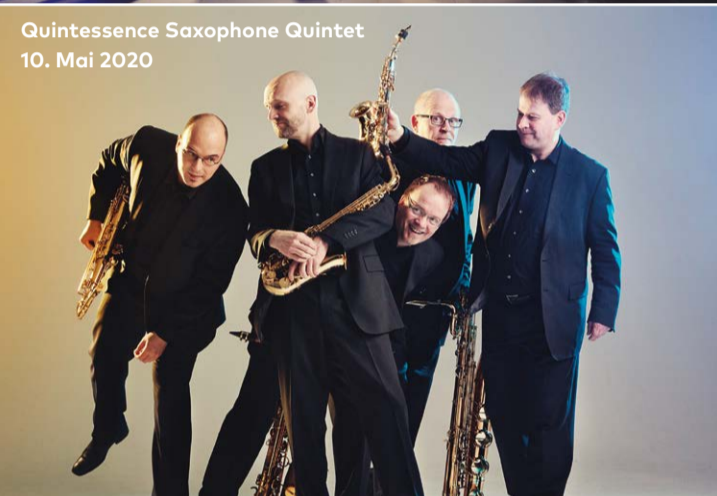
Quintessence Saxophone Quintet 10. Mai 2020