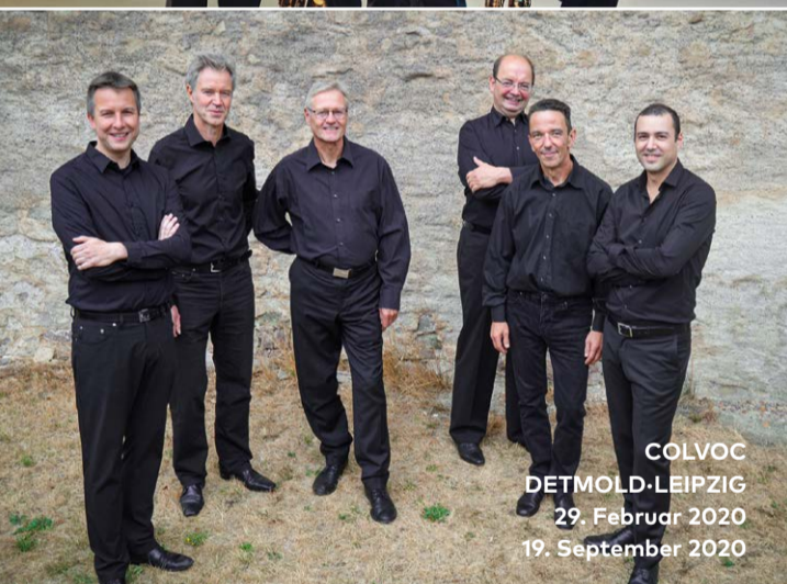
COLVOC DETMOLD-LEIPZIG 29. Februar 2020 19. September 2020