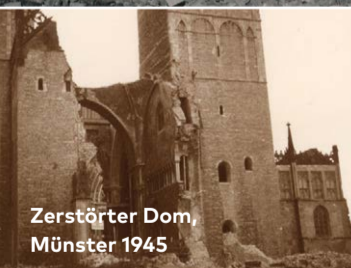
Zerstörter Dom, Münster 1945