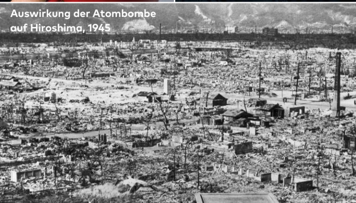
Auswirkung der Atombombe auf Hiroshima, 1945