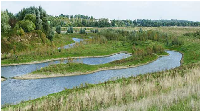
Neuentwicklung der Lippemündung

Die Veranstalter freuen sich auf eine rege Teilnahme an der Veranstaltung und eine spannende Diskussion.