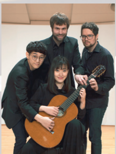
Polaris Guitar Quartet