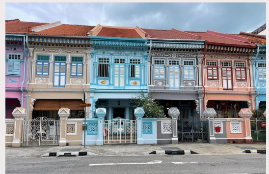
Eigenes Bild: Häuserreihe in Katong

Nachhilfe – es gibt die Möglichkeit einzelnen Schüler:innen Nachhilfe zu geben und dadurch zusätzliches Geld zu verdienen. Die Vermittlung und auch die Bezahlung läuft über die Schule.