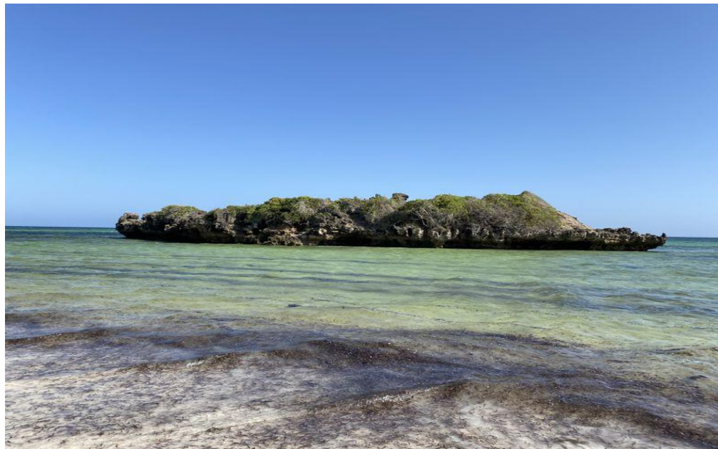
Die Küste von Watamu