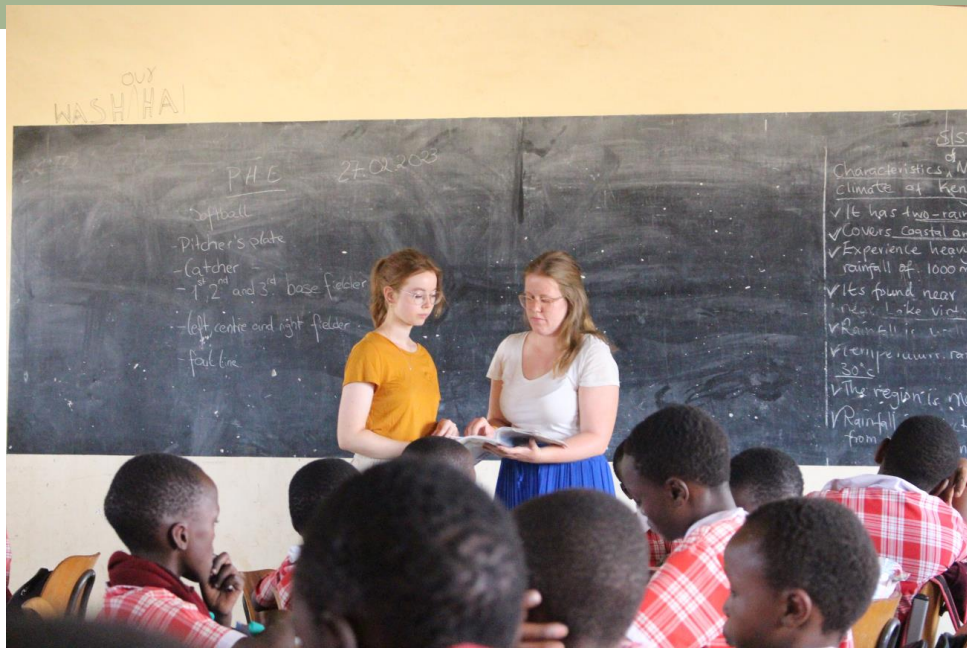
Eine der fünften Klassen während des Unterrichts