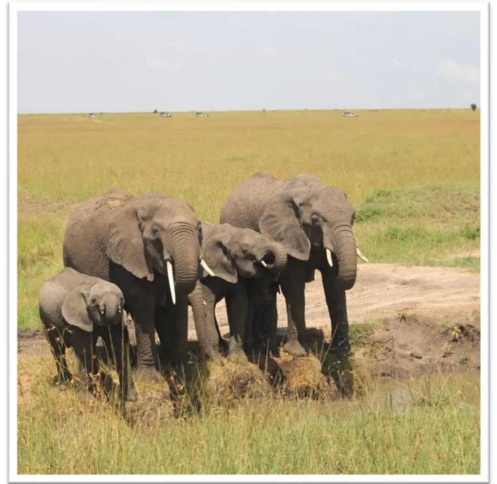
Eine Elefantenherde am Wasserloch

Bei der Übernachtung in der Lodge konnten wir Zebras, Hippos und Giraffen direkt vor unserer Hütte erleben. So unterschiedliche Tiere hautnah zu entdecken, war für uns definitiv ein beeindruckendes Highlight!