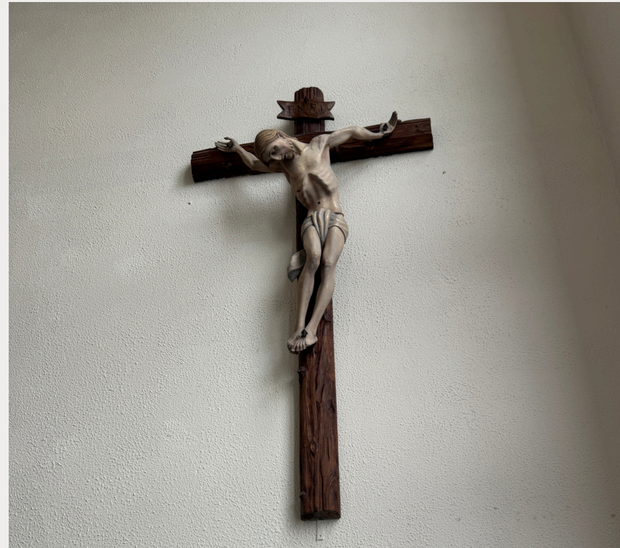
Abb. 1: Chrstliches Symbol im Schulflur

! Viele Schulen in Irland sind katholisch geprägt