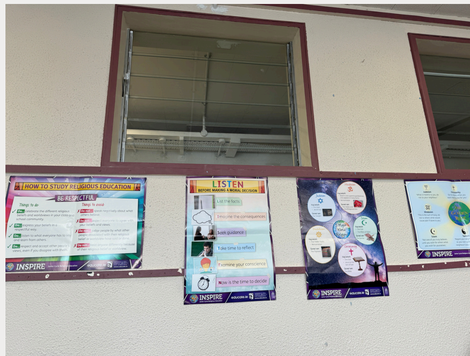
Abb. 2: Der Religionsraum