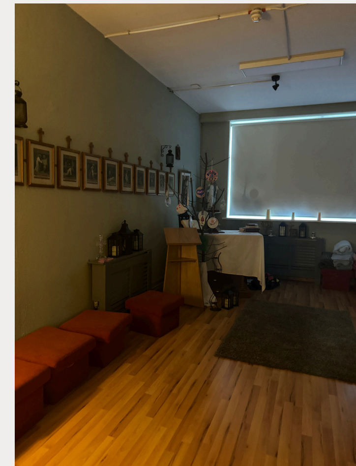
Abb. 4: Der Gebetsraum im High Cross College