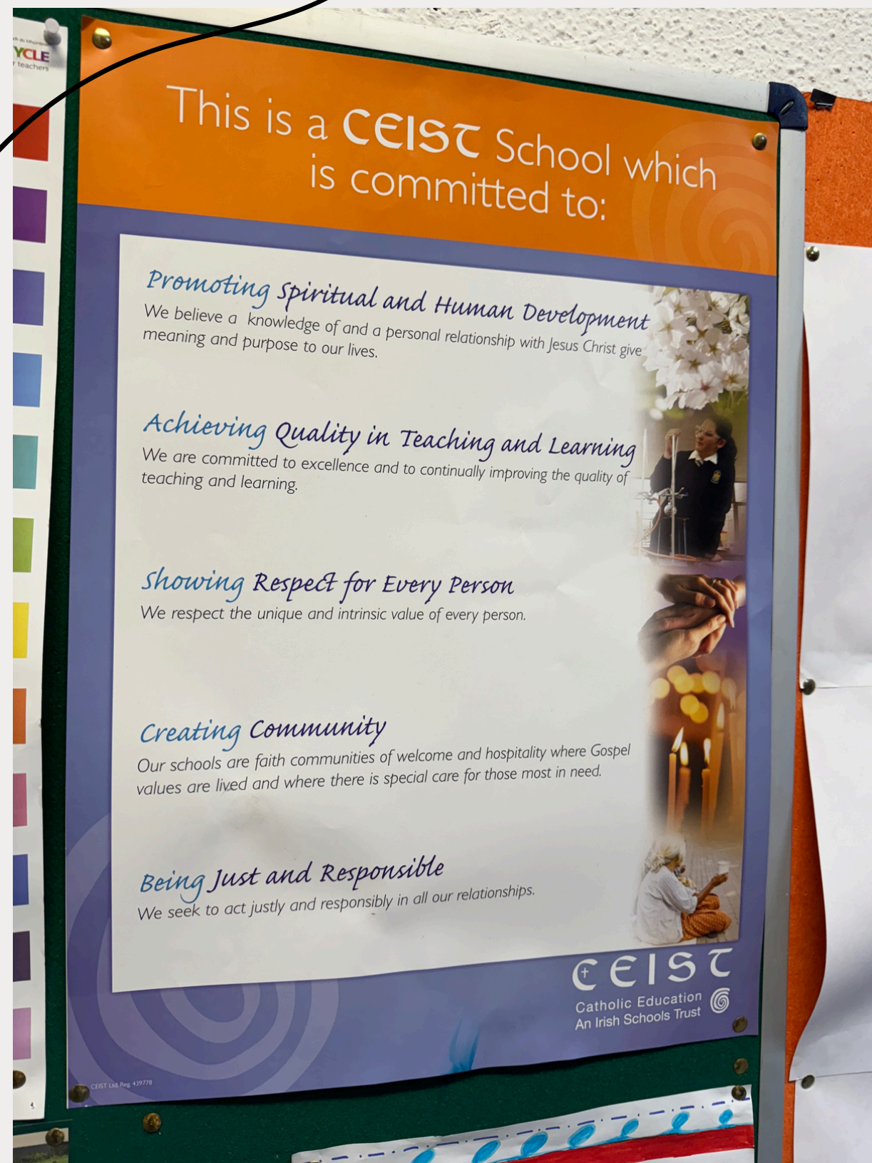
Abb. 5: Plakat mit den Zielen von CEIST im Schulflur vom HCC