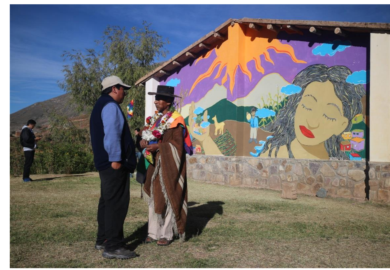
„La Madre tierra“ Die Mutter Erde als Symbol und Alltagslandschaft

In der aktuellen Forschungsphase untersuche ich im ländlichen andinen Raum im Nordwesten Argentiniens, wie eine indigene Gemeinschaft durch gemeinsame Verhaltensregeln, Riten und Praktiken eine vielfältige Landschaft und Agrobiodiversität hervorbringt. Für diese Region gilt als typisch, dass die Umweltwahrnehmung stark durch die überlieferten und imaginierten Lebensgewohnheiten der Vorfahren geprägt ist. Es gilt als überlebenswichtig, eine gute, achtsame Beziehung zueinander und zur ‚Mutter Erde‘ zu halten.