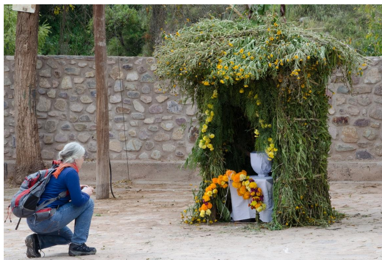
„La siembra“ Die Aussaat als religiöses Ritual und als landwirtschaftliche Praxis