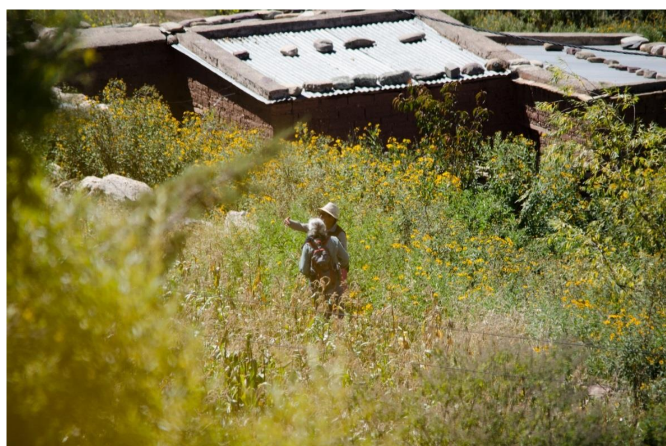
„Los saberes de los ancestros“ Überliefertes Wissen und Systematisierung durch ethnobotanische Studien