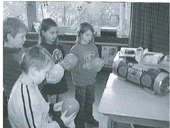
(Abbildung aus Möller et al., 2008, 48)

Die LP organisiert und leitet das Klassengespräch, regt an, Beobachtungen und Erkenntnisse aus den Versuchen einzubringen, nimmt Fragen und Anregungen der SuS auf und fördert das Klären von Sachverhalten u.a. auch mit entsprechenden Veranschaulichungen.