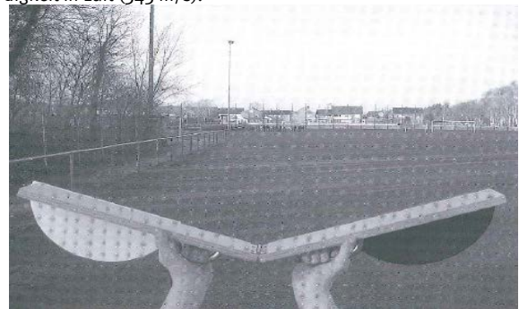
(Abbildung aus Möller et al., 2008, 16)

Schall breitet sich sehr schnell aus – aber viel langsamer als Licht. Die Schallgeschwindigkeit in festen Stoffen (z. B. Eisen 5170 m/s) ist größer als die in flüssigen Stoffen (z. B. Wasser 1480 m/s) und diese wiederum ist größer als die Schallgeschwindigkeit in Luft (343 m/s).