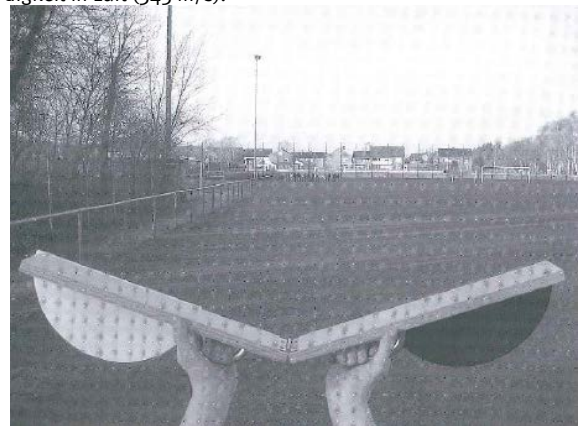
(Abbildung aus Möller et al., 2008, 16)

Schall breitet sich sehr schnell aus – aber viel langsamer als Licht. Die Schallgeschwindigkeit in festen Stoffen (z. B. Eisen 5170 m/s) ist größer als die in flüssigen Stoffen (z. B. Wasser 1480 m/s) und diese wiederum ist größer als die Schallgeschwindigkeit in Luft (343 m/s).