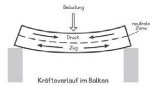
(Abbildungen aus Lemmen et al., 2008, 19)