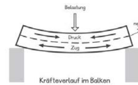
(Abbildungen aus Lemmen et al., 2008, 19)