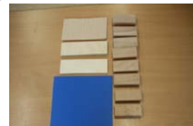
(das im Unterricht verwendete Material)

Bei Belastung einer Balkenbrücke treten in der Fahrbahn Druck- und Zugkräfte auf. Das Material des Trägers wird bei der Durchbiegung oben zusammengedrückt (Druckkräfte) und unten auseinander gezogen (Zugkräfte). In der Mitte des Trägers befindet sich die sogenannte neutrale Zone in der keine Kräfte auftreten. Je weiter die wirkenden Kräfte auseinander liegen, umso größer der Widerstand gegen die Durchbiegung und umso belastbarer ist die Brücke. Je dicker der Träger, desto stabiler ist er. Ein dicker Träger besitzt jedoch ein hohes Eigengewicht, das von den Stützen abgefangen werden muss. Außerdem wird viel (teures) Material benötigt.