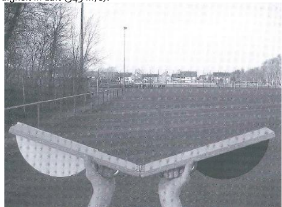
(Abbildung aus Möller et al., 2008, 16)

Schall breitet sich sehr schnell aus – aber viel langsamer als Licht. Die Schallgeschwindigkeit in festen Stoffen (z. B. Eisen 5170 m/s) ist größer als die in flüssigen Stoffen (z. B. Wasser 1480 m/s) und diese wiederum ist größer als die Schallgeschwindigkeit in Luft (343 m/s).