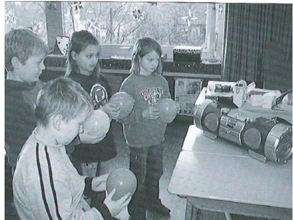
(Abbildung aus Möller et al., 2008, 48)

Die LP führt ins Gespräch ein, unterbreitet die Fragestellungen, nimmt Erklärungen der SuS auf und fördert den Verstehensprozess zu dieser anspruchsvollen Thematik.