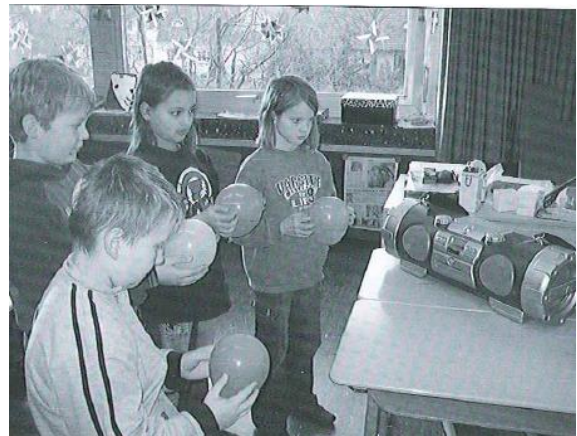
(Abbildung aus Möller et al., 2008, 48)

Die LP arrangiert die Austauschrunde zu den Versuchen, nimmt die Beiträge der SuS auf und unterstützt bei der Klärung von Fragen und Sachverhalten.