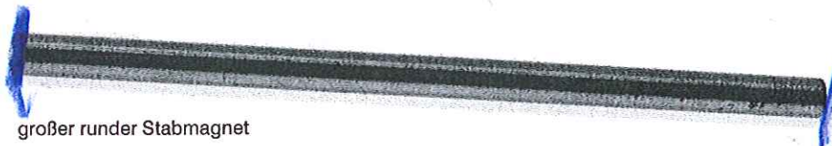
großer runder Stabmagnet