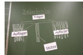
(das im Unterricht verwendete Material)

Bei einer Balkenbrücke liegt ein Träger (Fahrbahn) auf beiden Seiten auf Auflagern. Der Träger kann mit weiteren Stützen verstärkt werden.