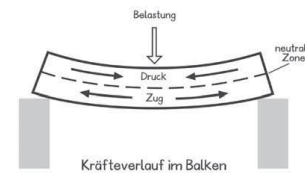
(Abbildungen aus Lemmen et al., 2008, 19)