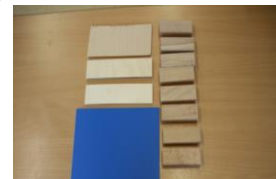
(das im Unterricht verwendete Material)

Bei Belastung einer Balkenbrücke treten in der Fahrbahn Druck- und Zugkräfte auf. Das Material des Trägers wird bei der Durchbiegung oben zusammengedrückt (Druckkräfte) und unten auseinander gezogen (Zugkräfte). In der Mitte des Trägers befindet sich die sogenannte neutrale Zone in der keine Kräfte auftreten. Je weiter die wirkenden Kräfte auseinander liegen, umso größer der Widerstand gegen die Durchbiegung und umso belastbarer ist die Brücke. Je dicker der Träger, desto stabiler ist er. Ein dicker Träger besitzt jedoch ein hohes Eigengewicht, das von den Stützen abgefangen werden muss. Außerdem wird viel (teures) Material benötigt.