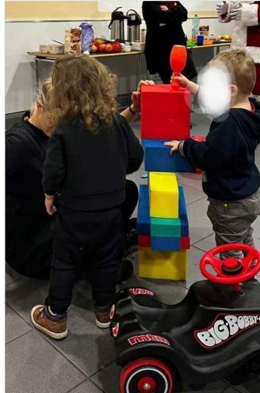
Studi-Kidz-Café im Wintersemester 2023

Ein besonderes Highlight im letzten Jahr war wohl der Termin im Dezember: Neben adventlicher Stimmung wurde auch das jüdische Lichterfest Channukah gefeiert, das mit dem Sonnenuntergang an diesem Tag begann. Und so gab es neben Plätzchen auch Sufganiyot (Krapfen) und neben Weihnachtssternen konnten auch kleine Dreidl (ein traditioneller Kreisel, mit dem Kinder an Channukah um „gelt“, Schokoladentaler spielen) gebastelt werden. Unter den Eltern kam währenddessen ein reger Austausch über das Studierendenleben mit Kind zustande.