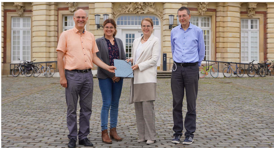
Überreichen der Unterschriften