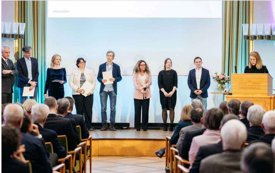
Verleihung des Gleichstellungspreises 2023

Der Gleichstellungspreis wurde dieses Jahr im Rahmen des Neujahrsempfangs für die beste Initiative mit Genderbezug verliehen. Der Preis ist mit 20.000 Euro dotiert, welche gleichmäßig auf zwei Projekte verteilt werden.