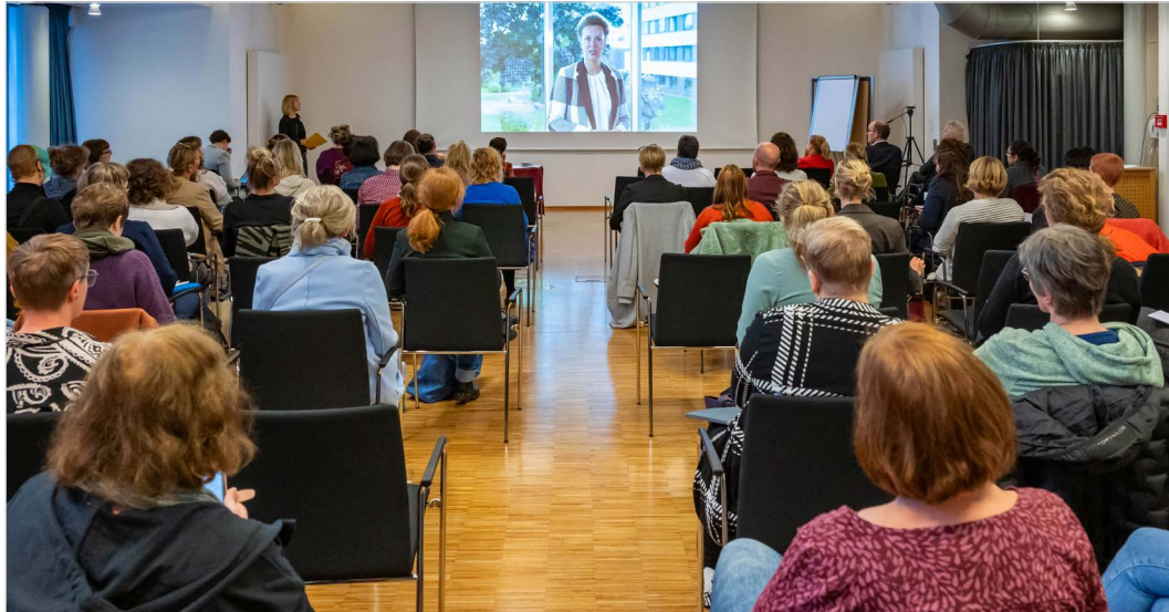
LaKof Herbsttagung in Münster

Organisatorinnen der Herbsttagung am 26. und 27. Oktober 2023 waren die Gleichstellungsbeauftragten von Universität und FH Münster, der Kunstakademie sowie des Universitätsklinikums Münster (UKM). Im Mittelpunkt standen Aufklärung, Prävention und Schutz vor sexualisierter Gewalt mit dem Ziel, neben den bereits vorhandenen Strukturen an Hochschulen weitere entsprechende Richtlinien und Rahmenbedingungen, Schutzkonzepte sowie Unterstützungs- und Vernetzungsangebote für Ansprechpersonen zu schaffen.