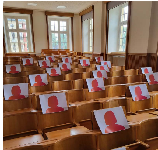
Weibliche Silhouetten im Hörsaal

Unterstützende Angebote, wie das Hilfefon der Bundesregierung, oder universitätsinterne Beratungsangebote sind dabei wichtige Anlaufstellen für Betroffene. Doch auch jede*r Einzelne kann durch ein aufmerksames Miteinander einen Unialltag