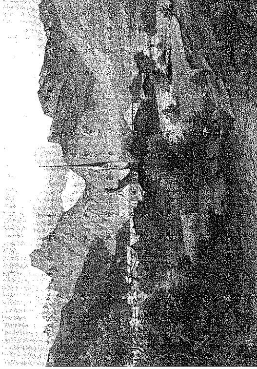
Zell am Ziller auf einer Lithographie um 1870.

sondern auch genug Gelegenheit finden, eine Menge von Leuten, jedes Alters und Geschlechts, zu verbinden. Zuerst kommt etwa einer, der dich um eine Pfeife Tabak anspricht und auch für seine Freunde in die Tasche schiebt, dann wird dir einer voll Einfalt anvertrauen, wie er schon das ganze Hochamt über soviel Durst ausgestanden, daß er den festen Gläubigen habe, der gültige Herr werde ihm ein Seidel Wein zahlen; ein blondlockiger Junge nimmt dich bei der Hand und geleitet dich lächelnd zu einer lächelnden Höckerin, wo du ihm Zibebenbrot kaufen sollst; ein anderer bittet sich Birnen aus und andere, die teilnehmend herbeispringen, zeigen schmeichelnd auf die schönen Äpfel oder die süßen Zwetschen, die daneben stehen. Überdies findet sich vielleicht auch ein Mädchen, das sich beim Einblick in die offene Börse erinnert, wie gut ihr eine neue Hutschnur stehen würde, oder eine andere, die ein seidenes Halstuch wünscht. Du wirst allmählich etwas vorsichtiger, und so kann es kommen, daß du einem gebückten Greis, der dich mit dringender Herzlichkeit um ein Frackele Brantwein bittet, deine Hilfe versagen mußt, weil du dasselbe Begehren in der letzten Viertelstunde schon einem halben Dutzend anderer abgeschlagen oder auch, weil du keinen Kreuzer mehr in der Tasche hast.