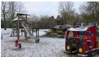
S p i e l p l ä t z e