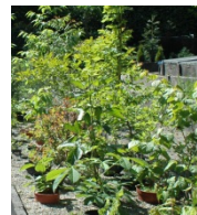
S t a u d e n