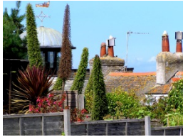
D a c h