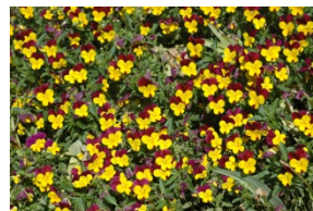
Z i e r p f l a n z e n