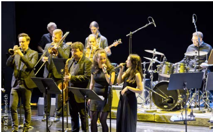
Galaxy Brass trifft Jazz Force One.

Close Up – Kammermusical Münster - Ordinary Days.