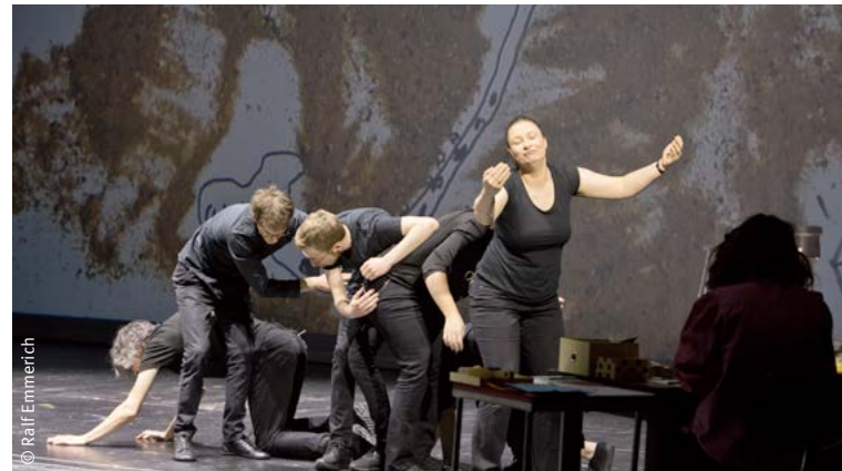
Peng! Improtheater und die Illustre Runde: Zeichenspiele – Illustration inspiriert Improtheater.