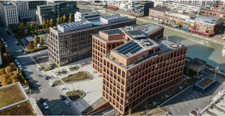
Besuch bei FIEGE im Bürogebäude X-Dock.

Im Juli 2025 waren die Mitglieder der Universitätsgesellschaft Münster im Rahmen der Veranstaltungsreihe „Universitätsgesellschaft vor Ort“ bei FIEGE im neuen Gebäude am Münsteraner Hafen zu Gast. Das Familienunternehmen wurde 1873 gegründet und wird heute in fünfter Generation geführt. Mit über 22.000 Mitarbeitenden an 139 Standorten in 14 Ländern zählt FIEGE zu den führenden Anbietern der europäischen Kontraktlogistik.