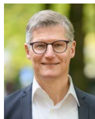
Tilman Fuchs Oberbürgermeister der Stadt Münster