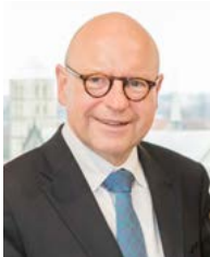
Markus Lewe Oberbürgermeister a. d. der Stadt Münster