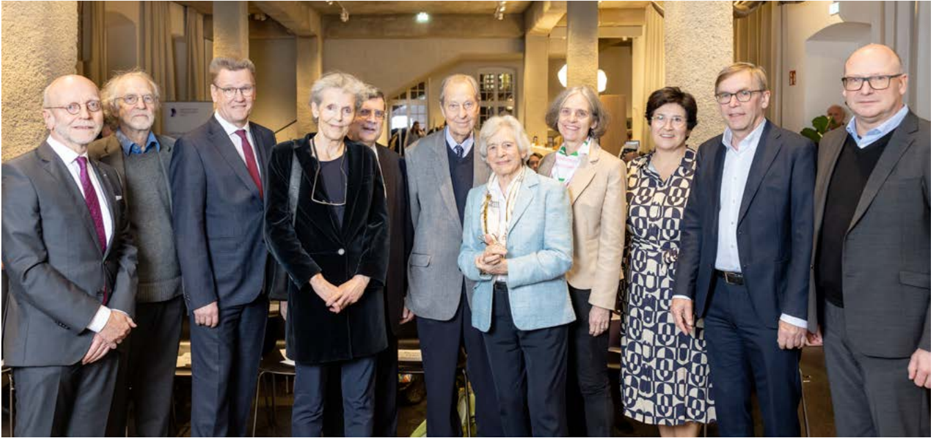
Gratulationen an die Preisträgerin des Ernst Hellmut Vits-Preises 2024, Prof. Dr. Dr. h.c. Gertrude Lübbe-Wolff, LL.M. (Vierte von links)

Der Ernst Hellmut Vits-Preis ist mit 20.000 € dotiert und ist die höchstdotierte Auszeichnung der Universitätsgesellschaft Münster. Alle zwei Jahre würdigt die Gesellschaft damit herausragende wissenschaftliche Leistungen, die in besonderer Weise zur geistigen und gesellschaftlichen Entwicklung beitragen. Im Jahr 2024 ging die Auszeichnung an die Rechtswissenschaftlerin Prof. Dr. Dr. h.c. Gertrude Lübbe-Wolff, LL.M., die mit ihrem jahrzehntelangen Wirken als Forscherin, Richterin und öffentliche Intellektuelle Maßstäbe gesetzt hat. Mit der Preisvergabe ehrt die Universitätsgesellschaft Münster eine Persönlichkeit, deren wissenschaftliches