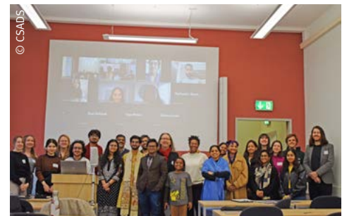
Gruppenfoto aller Teilnehmer