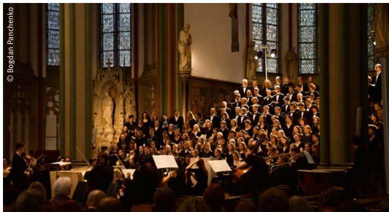
Das Konzert in der Kreuzkirche