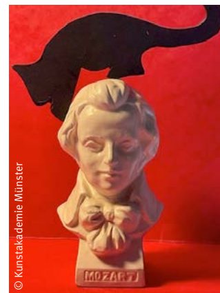
„Der Schauspieldirektor“ / „Meow and forever“