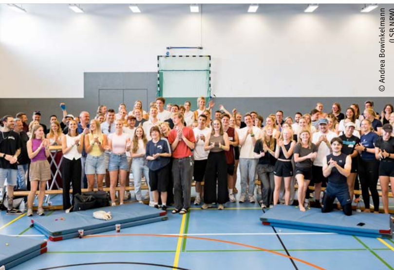
Studierende beim Demokratie-Festival in Münster