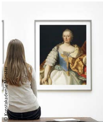
links und mitte „Ascanio in Alba oder Gefährliche Liebschaften“