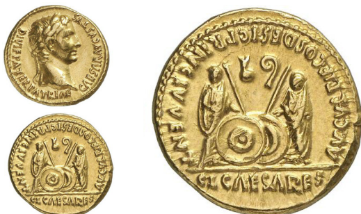
Abb. 4: Aureus: Vs. Augustus – Rs. Gaius Caesar und Lucius Caesar, jeweils mit Speer und Schild (Rs. ist ikonographisches Vorbild für den vespasianischen Denar Abb. 3; Maßstab 1 : 1 und Rs. in Vergrößerung 2 : 1), Künker 204 (12.3.2012) Nr. 514