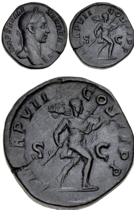
Abb. 7: Sesterz: Vs. Alexander Severus – Rs. Romulus im Panzer mit gebauschtem Gewand, trägt Speer und tropaeum (Maßstab 1 : 1 und Rs. in Vergrößerung 2 : 1) CNG, Mail Bid Sale 84 (5.5.2010) Nr. 1123