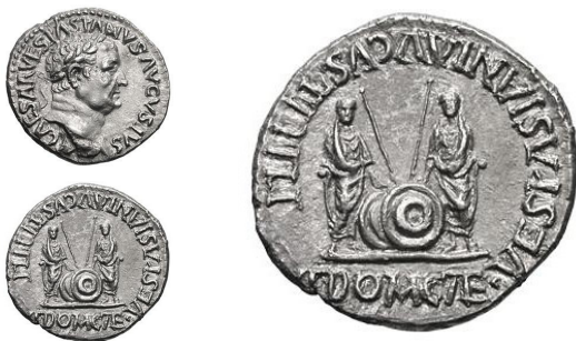
Abb. 3: Denar: Vs. Vespasian – Rs. Titus und Domitian, jeweils mit Speer und Schild (nach dem augusteischen Vorbild Abb. 4; Maßstab 1 : 1 und Rs. in Vergrößerung 2 : 1) Gemini LLC IV (8.1.2008) Nr. 406