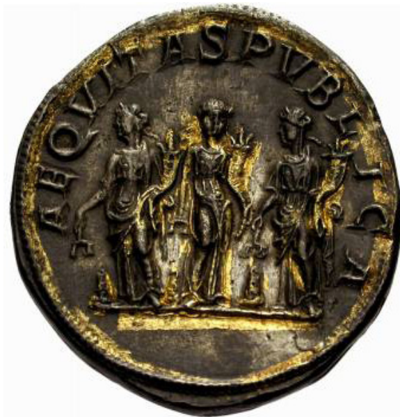
Abb. 5: AR-multiplum (im Wert von 12 Denaren): Vs. Severus Alexander und Iulia Mamaea – Rs. Die drei Monetae, jeweils mit Füllhorn und Waage vor einem Altar NAC 27 (12.5.2004) Nr. 462

Augustus bis Philippus I. Arabs (27 v. Chr. – 249 n. Chr.). Er kommt dabei zu dem Schluss, dass diese Medaillons (Abb. 5) hauptsächlich als Presti-