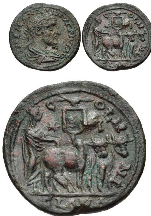
Abb. 1: Æ aus Ninika-Klaudiopolis: Vs. Maximinus Thrax – Rs. Pflüger mit Ochsespann (Maßstab 1 : 1 und Rs. in Vergrößerung 2 : 1)