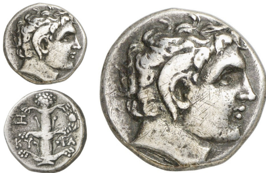
Abb. 2: AR-Didrachme aus Kyrene mit Apollon Karneios auf der Vs. und Silphiumpflanze auf der Rs.; Maßstab 1 : 1 und Vs. in Vergrößerung 2 : 1; Künker 262 (13.3.2015) Nr. 7355