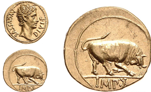
Abb. 19: Aureus des Augustus, Lyon, 15–13 v. Chr.; Maßstab 1 : 1 und Rs. in Vergrößerung 2 : 1; Berlin 18202567

die Rekonstruktion des Prägesystems sowie die Bestimmung und Analyse der von Vespasian genutzten Vorbilder vorstellte. Ziegert konnte nun eine chronologische Feinabstimmung der Prägung vorlegen und detailliert Kontinuitäten und Brüche im Prägeprogramm aufzeigen. Daneben analysierte er die verschiedenen Vorbilder, die Vespasian für das Typenrepertoire seiner Münzen nutzte (Abb.