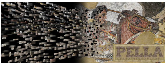
Abb. 13–16: Webbanner von CRRO, CHRR, OCRE und PELLA