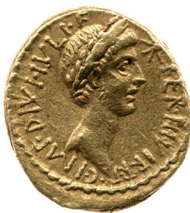
Abb. 8: Aureus des Octavian (RRC 534/1); Maßstab 1 : 1 und Vs. in Vergrößerung 2 : 1; London, British Museum, R.9428