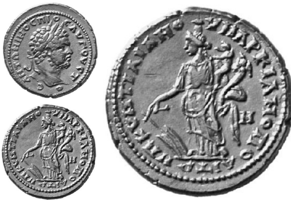
Abb. 10: Sonderform der Tyche mit Kind: AE aus Markianopolis unter Caracalla; Lanz 121 (22.11.2004) Nr. 479; Maßstab 1 : 1 und Rs. in Vergrößerung 2 : 1