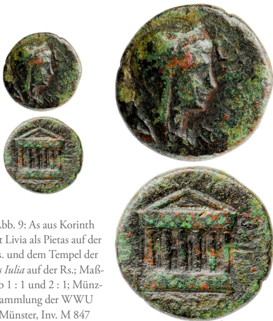
Abb. 9: As aus Korinth mit Livia als Pietas auf der Vs. und dem Tempel der gens Iulia auf der Rs.; Maßstab 1 : 1 und 2 : 1; Münzsammlung der WWU Münster, Inv. M 847