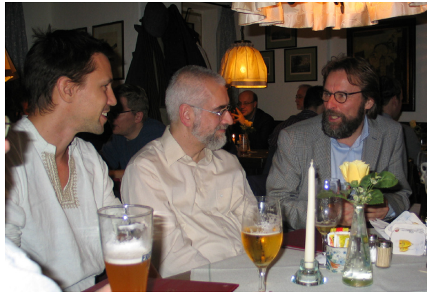
Abb. 3–7: Abendveranstaltung und Gesprächspausen