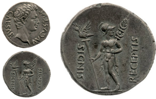
Abb. 18: Denar des Augustus aus Colonia Patricia (Hispania); Maßstab 1 : 1 und Rs. mit Mars Ultor in Vergrößerung 2 : 1; British Museum, 1860,0330,9.

testgehend erhalten (Abb. 17), nicht jedoch Arme und Hände mit den eventuell gehaltenen Objekten. Während für die Linke klar war, dass sie einen zylindrischen Gegenstand gehalten hat, wurde die Rechte zu einem Redegestus ( adlocutio ) ergänzt. Da der Ringfinger allerdings original gekrümmt ist, muss diese Hand ebenfalls einen Stab gehalten haben, und anhand von Plastiken und vor allem Münzbildern gelang es Özgen, einen neuen Rekonstruktionsvorschlag zu machen. So zeigen Münzen des Augustus (z. B. RIC I 2 82; Abb. 18) den Mars Ultor mit zwei Feldzeichen in den Händen: rechts die Aquila, den Legionsadler, links ein Kompositissignum; den Schriftquellen zufolge hat Augustus nach dem Sieg über die Parther eine Statue des Mars Ultor mit den zurückeroberten Feldzeichen in einem Tempel auf dem Kapitol aufstellen lassen. Die Statue von Prima Porta stellt somit Augustus als Mars Ultor dar, wie er die parthischen Feldzeichen der Gottheit weiht.