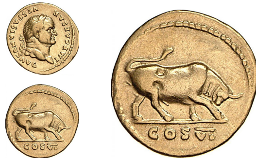
Abb. 20: Aureus des Vespasian, Rom, 75 n. Chr. nach dem augusteischen Vorbild (siehe Abb. 17); Maßstab 1 : 1 und Rs. in Vergrößerung 2 : 1; Berlin 18219189; Foto Dirk Sonnewald

19–20): Die starke Präsenz republikanischer und augusteischer Motive sowie solcher des unmittelbaren Nero-Nachfolgers Galba ist bezeichnend für die vespasianische Bild-Programmatik, die sich bewusst von der Neros abheben sollte und gleichzeitig auf traditionelle republikanische Werte baute. Dies zeigt sich sowohl bei den Edelmetallmünzen als auch ähnlich im Buntmetall.