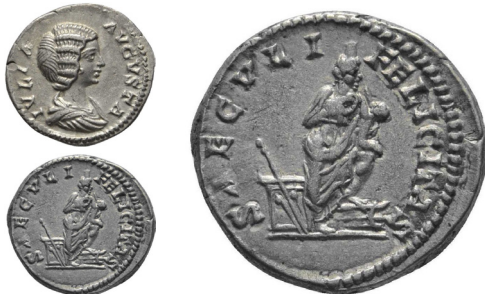
Abb. 11: Sonderform der Tyche mit Kind: Denar der Julia Domna; Münze aus Privatbesitz; Maßstab 1 : 1 und Rs. in Vergrößerung 2 : 1

Personifikation, während durch die Hinzufügung eines Getreidebündels in Pautalia der Fruchtbarkeitsaspekt betont ist. Markianopolis stärkte mit der Hinzufügung eines Palmzweigs den Siegescharakter, das Attribut des Rades wie in Deultum brachte sie mit Nemesis in Verbindung. Ähnliche Synkretismen können auch in der stadtrömischen Denarprägung beobachtet werden: So wurde wie in Markianopolis (Abb. 10) auf Reichsprägungen von Caracalla und Julia Domna (Abb. 11) die Göttin mit einem Kind im Arm dargestellt – entsprechend der Isis mit dem Horusknaben.