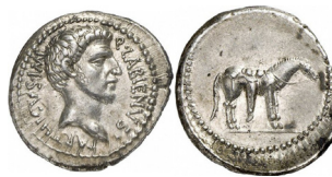
Abb. 7: Denar des Ventidius Bassus (Maßstab 1 : 1 und 2 : 1); Gorny & Mosch 185 (8.3.2010) Nr. 229