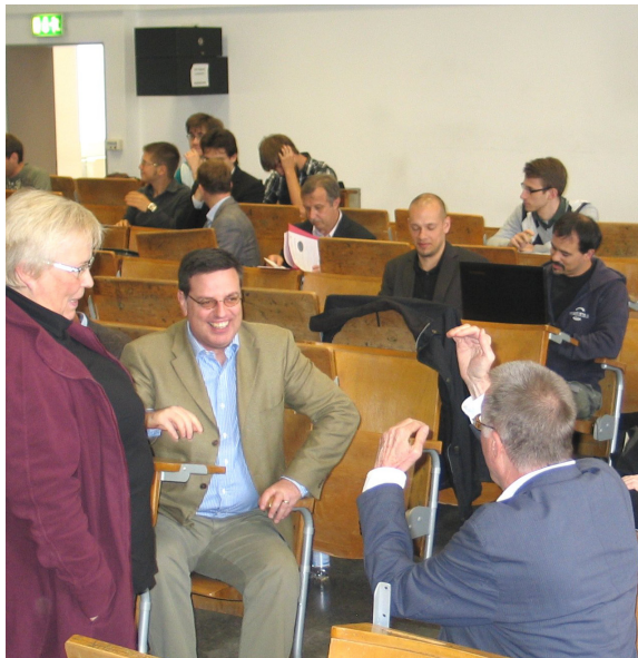
Abb. 4–5: Unterschiedliche Nutzung der Pausen