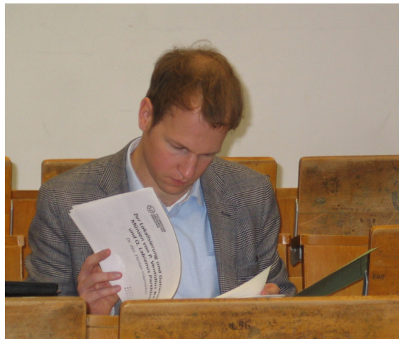
Abb. 6: letzte Vorbereitungen