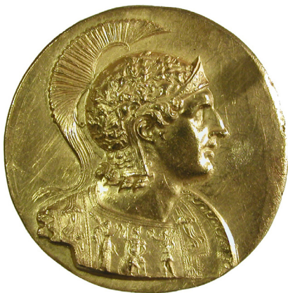
Abb. 1: Goldmedaillon mit dem Bildnis Alexanders des Großen, Lissabon, Gulbenkian: Dressel VI

Eine numismatische Blütenlese zu Alexanderbildern im Bild“ der kaiserzeitlichen Rezeption und Instrumentalisierung des großen Feldherrn widmete. Ausgehend von in der archäologischen Forschung bislang nur wenig beachteten Münzen, die Alexander in Bezugnahme auf dessen kriegerische Erfolge als Schildzeichen des Kaisers Caracalla präsentieren, stellte Dahmen verschiedene ganzfigurige Alexander-Darstellungen und szenische Kontexte vor, die in der Kaiserzeit genutzt wurden, um den eigentlichen Schildträger in eine erfolgreiche Alexandernachfolge zu verorten. Mithilfe dieser Retrospektive reflektierte er dann auch über das mögliche Aussehen des originären Schildzeichens des Makedonenkönigs selbst.