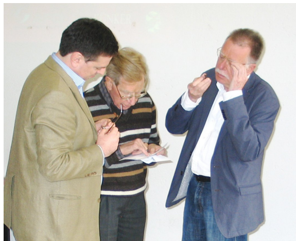
Abb. 2: Münzkundler unter sich

Das Programm am Samstag bot eine breite Palette numismatischer Forschung, die ikonografische Studien von der Klassik bis in die Spätantike fokussierte, doch ebenso die Diskussion methodischer Zugänge zum Fach beinhaltete