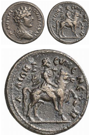
Abb. 8: AE aus Eumeneia in Phrygien mit Reitergott auf der Rs. (Maßstab 1 : 1 und Rs. in Vergrößerung 2 : 1) Künker (16.3.2007) Nr. 9184