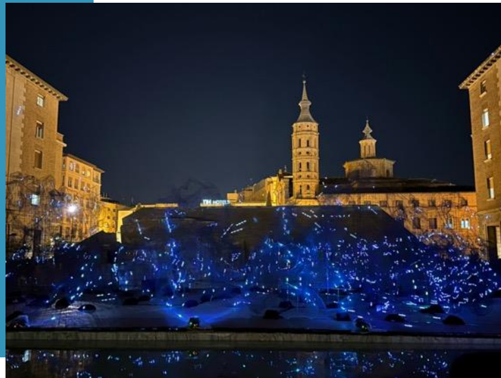
Lichter am Fuente de la Hispanidad