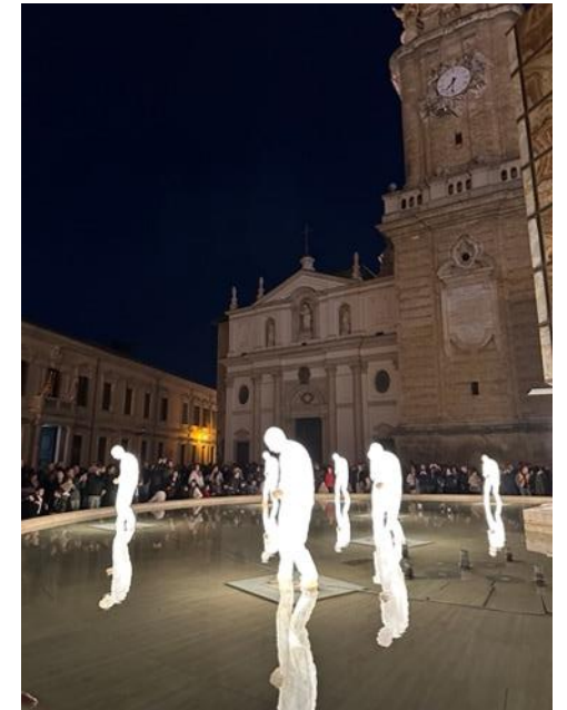
Lichter am Plaza La Seo