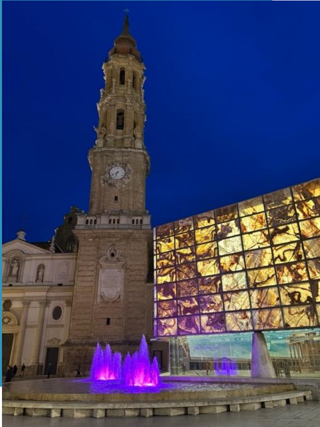
La Seo im Dunkeln