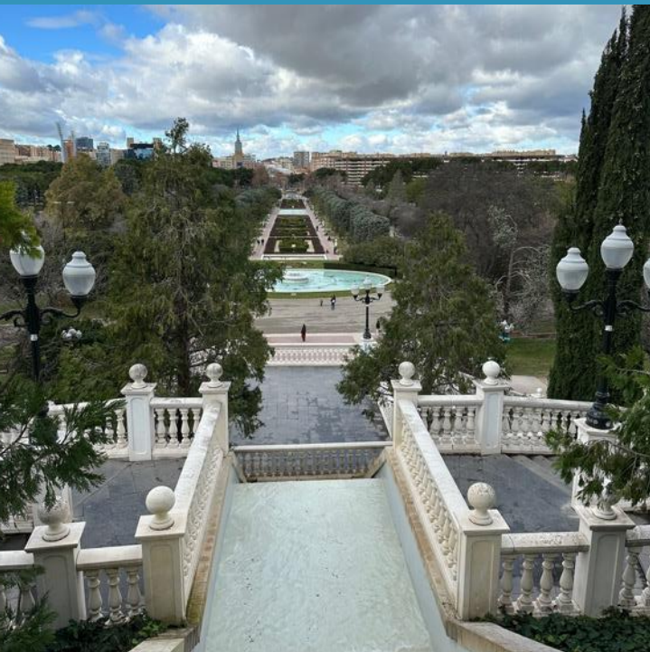
Parque Grande José Antonio Labordeta (der im Sommer mit Sicherheit noch schöner aussieht)