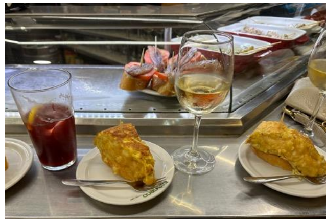
Tortilla de Patatas mit Sangria bzw. Weißwein direkt an der Theke