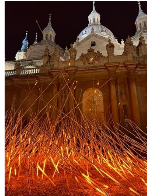
Lichter vor der Basílica del Pilar