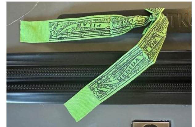
Band an meinem Koffer