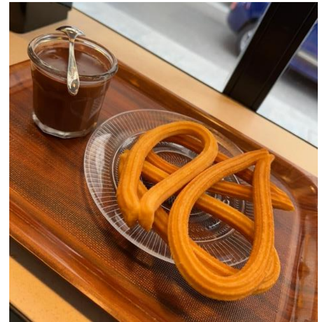
Churros mit einer Tasse geschmolzener Schokolade