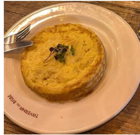
Tortilla de Patatas