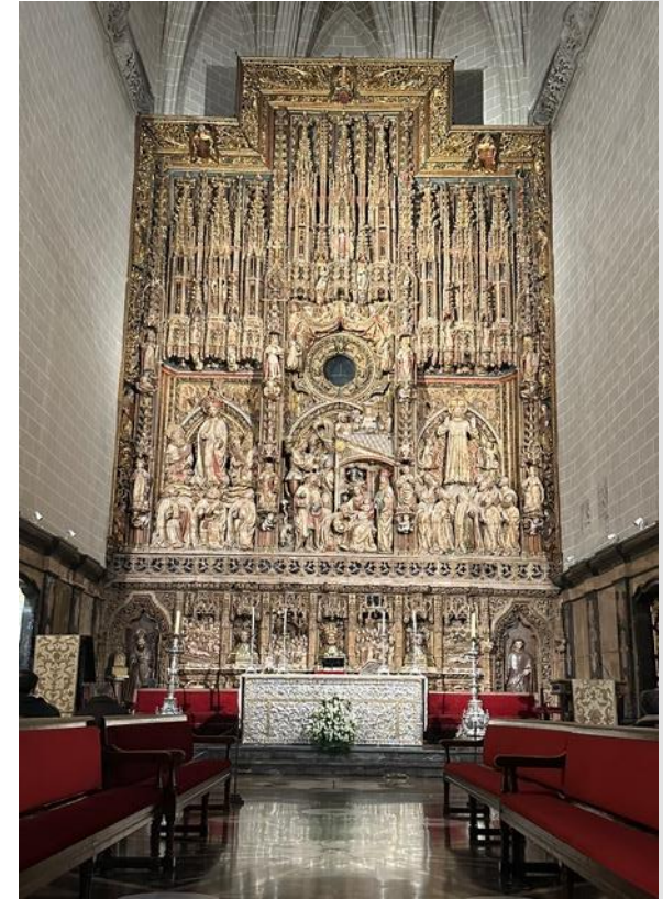
Altar mit vielen detailreichen Skulpturen im Hintergrund