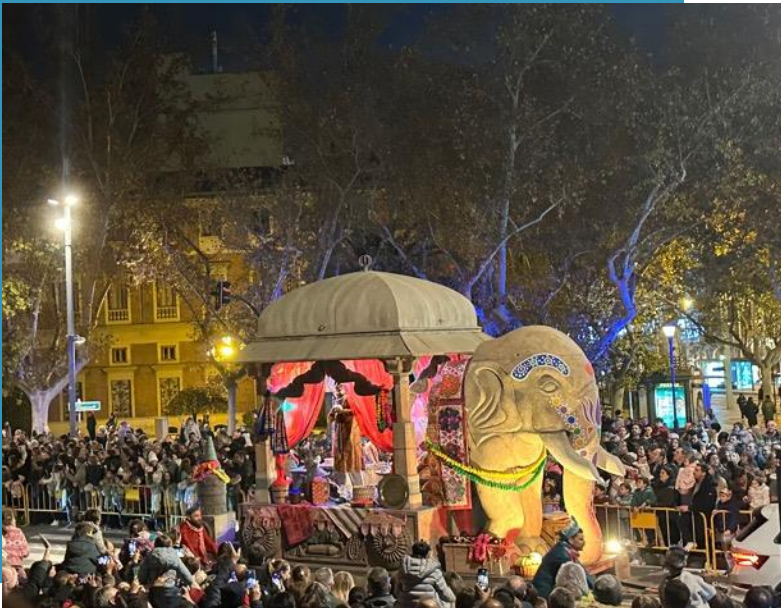
Einer der Heiligen Drei Könige während des Umzugs