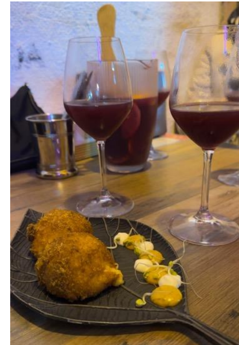
Croquetas de jamón (Kroketten mit Schinken) auf einem Tisch in einer der Gassen