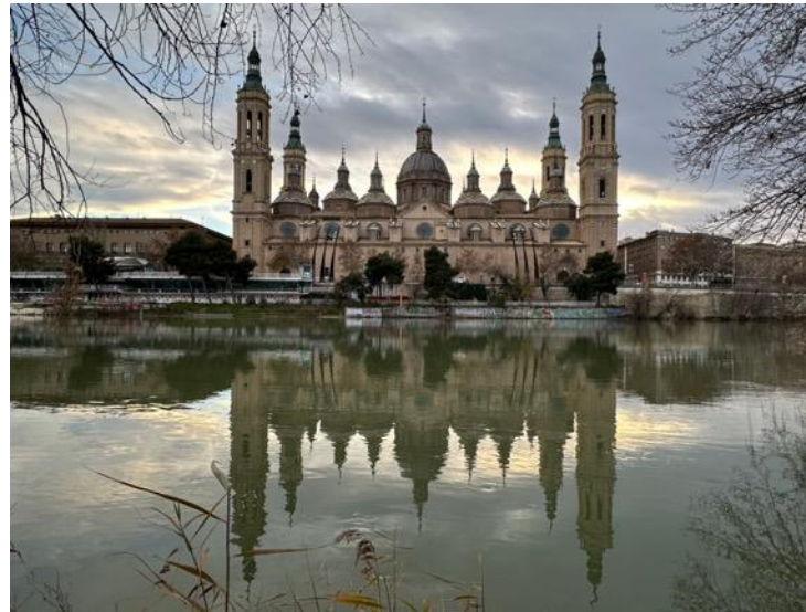
Bild von der anderen Seite des Flusses