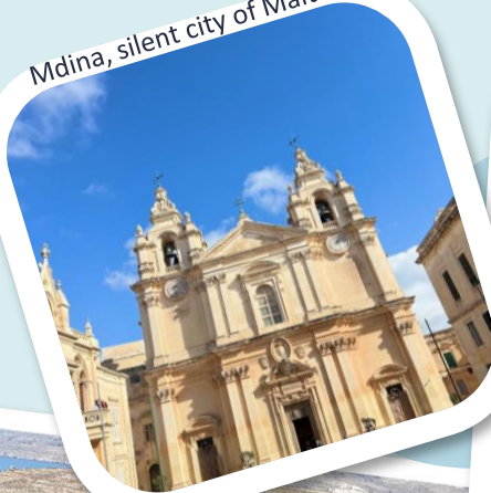
Mdina, silent city of Malta