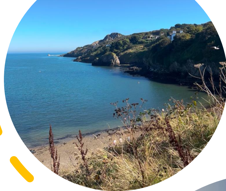
Balscadden Bay Beach