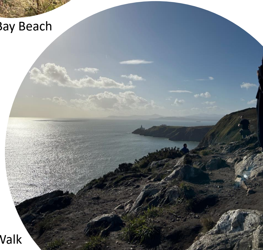
Howth Cliff Walk