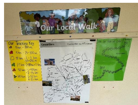
Figure 3: Our Local Walk

Newgrange ist von der Schule etwa 280 km entfernt. Gemeinsam haben wir uns das Ziel gesetzt, diese 280 km zu Fuß zurückzulegen. Dafür zählten sowohl die Kinder an der Schule als auch die Angestellten die Strecke, die sie zu Fuß zurücklegen. Gemeinsam haben wir ein System entwickelt, mit farbigen Holzsticks die zurückgelegte Strecke zu tracken. Für jede Runde um die Schule gab es einen braunen Stick = 250 m. Nach 5 km konnten 25 braune Sticks gegen einen roten ausgetauscht werden und so weiter. Unterstützt wurden wir von „Locals“, die ihre regelmäßigen Spaziergänge ebenfalls getrackt und die Strecken an uns weitergegeben haben.