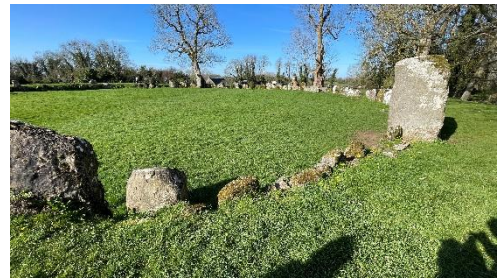
Figure 6: Grange Stone Circle

Wenige Kilometer entfernt ist ein großer Kreis aus Steinen. Forschende vermuten, dass dort im Steinzeitalter Rituale gefeiert wurden.