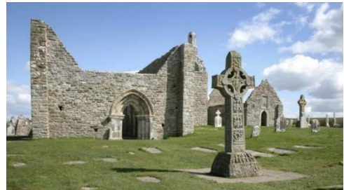
Figure 8: Clonmacnoise

Etwa 110 km nördlich vom Rock of Cashel befindet sich die Klosterstätte Clonmacnoise. Dieses Kloster entstand im 6. Jahrhundert, heutzutage befinden sich dort einige Ruinen dieses Klosters. Von Clonmacnoise sind es noch etwa 130 km zu Newgrange. 4