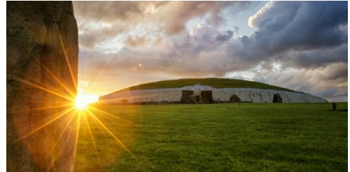
Figure 1: Newgrange

Newgrange ist ein 5.200 Jahre altes Durchgangsgrab im Boyne Valley im alten Osten Irlands. Es ist Teil des Brú na Bóinne, einem Komplex von Denkmälern entlang des Flusses Boyne. Gebaut wurde es während der Jungsteinzeit, etwa 3.200 v. Chr. Newgrange ist ein großer kreisförmiger Hügel, der eine Fläche von über einem Hektar bedeckt. Der 19 m lange Innengang führt zu einer kreuzförmigen Kammer mit Kragdach. 1