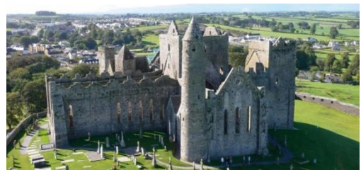
Figure 7: Rock of Cashel

Rock of Cashel ist etwas mehr als 50 km von Lough Gur entfernt. Dabei handelt es sich um ein Denkmal bestehend aus mittelalterlichen Gebäuden aus dem 15. Jahrhundert. Der Legende nach besuchte auch der Heilige Patrick diesen Ort. 3