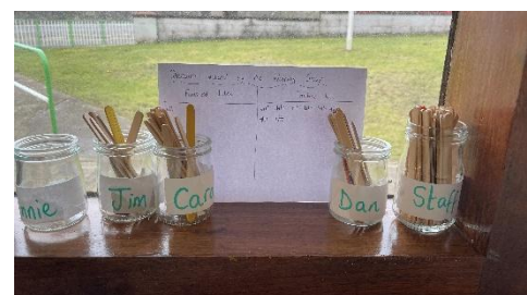
Figure 4: Sticks