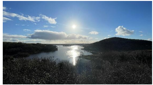
Figure 5: Lough Gur

Lough Gur ist ein See in der Nähe der Schule. Dort ist auch ein Besucherzentrum. Er ist etwa 10 km von der Schule im Ort entfernt und ist ein schöner Ort zum Spaziergehen. 2 Rund um diesen See gibt es viele unterschiedliche Sagen, die ihn zu einem wichtigen Teil der Irischen Kultur machen. Auch ein kleines Museum ist in dem Besucherzentrum in der Nähe des Sees.