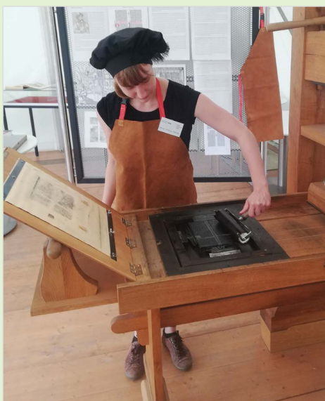
Drucken wie Gutenberg im Bibelmuseum

Wer hat Lust auf vier Tage mit Bastelarbeiten, tollen Spielen und spannenden Erkundungen? Im Bibelmuseum dürfen Kinder unter anderem erfahren und ausprobieren, wie das erste Buch gedruckt wurde oder wie man seine eigene Bibel gestalten kann. Das bunte Programm rund um Bücher und Bibeln bietet für alle was, ob drinnen, ob draußen – oder beim Ausflug ins Archäologische Museum. Das Programm richtet sich an Kinder im Alter von 6