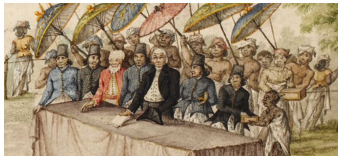
Holländischer Richter und lokale Würdenträger in Java (Gemälde von 1807, Ausschnitt)

The thematic range of the research projects comprises questions of ancient trade law, the royal power to pardon in late medieval France, legal pluralism in zones of cultural contact during colonialism and phenomena of forum shopping in current economic law. Generally, the Kolleg is characterized by a plurality of disciplines and methods and contributes to a better understanding within the humanities.