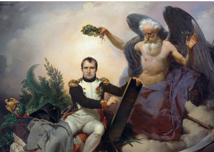
Napoleon schreibt den Code Civil (Gemälde von Jean-Baptiste Mauzaisse, 1833, Ausschnitt)

Das Käte Hamburger Kolleg „Einheit und Vielfalt im Recht“ (EVIR) untersucht aus genuin historischer Perspektive Phänomene der ungelösten Gleichzeitigkeit von Einheit und Vielfalt im Recht. Rechtsvielfalt, so unsere Annahme, ist nicht als Übergangsphänomen, sondern als ein überzeitliches und überregionales Strukturmerkmal des Rechts schlechthin zu begreifen. Zugleich lassen sich in allen Kulturen und zu allen Zeiten verschiedene Tendenzen zur Vereinheitlichung von Recht finden. Diese spannungsreiche Dynamik von Einheit und Vielfalt gilt es wissenschaftlich neu zu vermessen. Das Kolleg eröffnet damit ungewohnte Einsichten für das grundlegende Verständnis von Recht und Gesellschaft im Allgemeinen und von (rechtlichen) Umgangsweisen mit Formen kultureller Diversität im Besonderen.