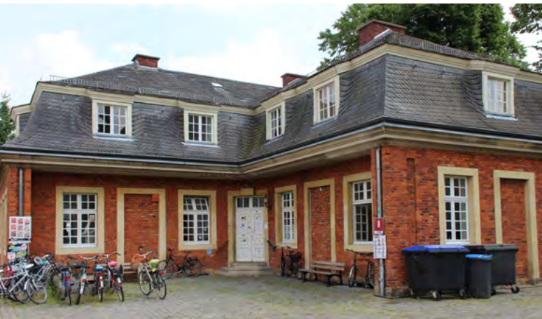
› Sitz vom AStA, linkes Kavalierhaus

Der AStA ist die politische Vertretung der Studierenden und setzt sich für die Belange der Studierenden ein. Darüber hinaus bietet der AStA einige Serviceleistungen an (u. a. kostenlose Beglaubigungen von Fotokopien, Bulliverleih, Sozial- und Rechtsberatung, Examenstarlehen, Zuschüsse und Darlehen für sozial bedürftige sowie ausländische Studierende, Semesterticketrückerstattungen).