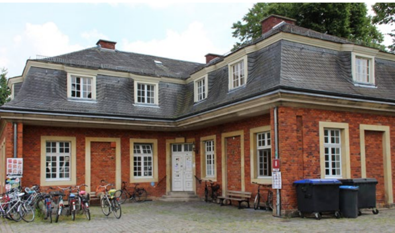
› Sitz vom AStA, linkes Kavalierhaus

Der AStA ist die politische Vertretung der Studierenden und setzt sich für die Belange der Studierenden ein. Darüber hinaus bietet der AStA einige Serviceleistungen an (u. a. kostenlose Beglaubigungen von Fotokopien, Bulliverleih, Sozial- und Rechtsberatung, Examenstarlehen, Zuschüsse und Darlehen für sozial bedürftige sowie ausländische Studierende, Semesterticketrückerstattungen).