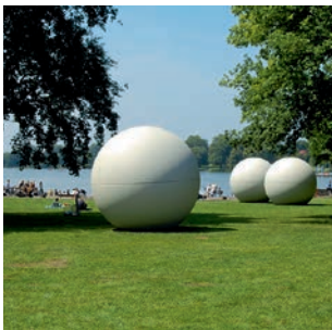
Kultur erleben, Entspannung genießen: Naherholung am Aasee