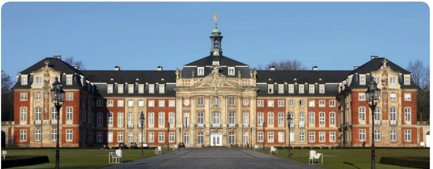
Das Schloss der Westfälischen Wilhelms-Universität Münster

Ausschließlich zur leichteren Lesbarkeit verzichten wir auf die durchgängige geschlechterdifferenzierte Schreibweise.