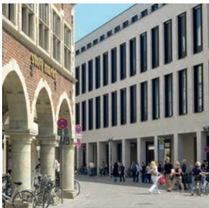
Geschichte trifft Gegenwart: die City mit den Münster-Arkaden