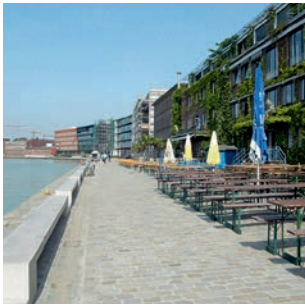
Ausgehmeile am Münsteraner Stadthafen: der Kreativ-Kai