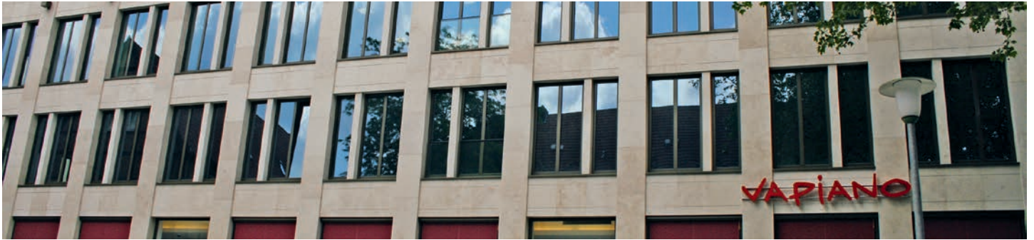
Der Kettlersche Hof in Münster