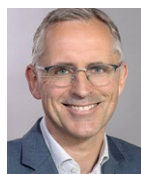
Prof. Dr. Christoph Brömmelmeyer, Europa-Universität Viadrina Frankfurt (Oder)

Die Lebensversicherung gewinnt – auch aufgrund des Rückzugs des Staates aus der individuellen Altersversorgung – immer mehr an Bedeutung. Das Modul verschafft den Teilnehmerinnen und Teilnehmern einen Überblick über die verschiedenen Arten der Lebensversicherung. Es behandelt u. a. die Besonderheiten beim Vertragsschluss, bspw. die Einwilligung der versicherten Person (§ 150 Abs. 2–4 VVG) und die Bestimmung des Bezugsberechtigten (§§ 159 f.), und bei der Durchführung des Vertrags. Dazu gehört insbesondere die Prämien- und Leistungsänderung (§ 163 VVG) sowie die Bedingungsanpassung (§ 164). Thematisiert werden auch die Schnittstellen des Lebensversicherungsrechts zum Insolvenz- und Erbrecht. Die Kernprobleme der Lebensversicherung werden im Detail behandelt: (1) Die Überschussbeteiligung (§§ 153 f.) soll unter Berücksichtigung der Entscheidungen des BVerfG analysiert werden. (2) Die Berechnung des Rückkaufswerts (§ 169) wirft viele noch ungeklärte Fragen auf, die vor dem Hintergrund des aktuellen Diskussionsstands aufgegriffen werden sollen.