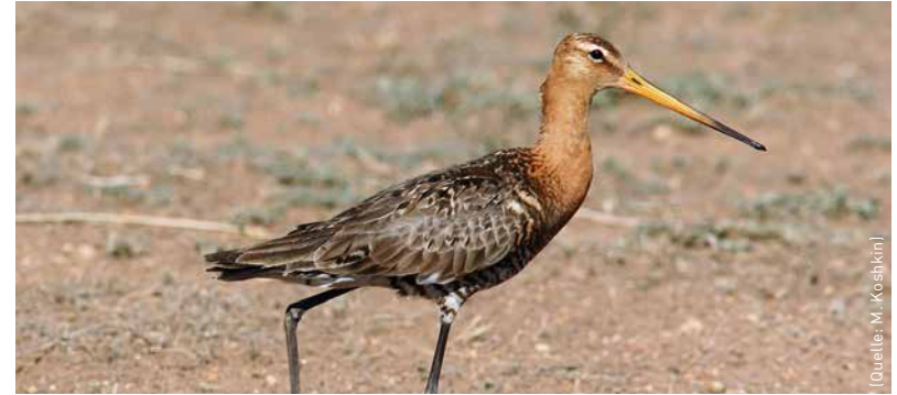
Uferschnepfe, auf Feuchtwiesen noch weit verbreitet.

Hözlzels Forschungsteams geht es in den acht Teilprojekten aber nicht nur darum, die Folgen des Landnutzungswandels für das Klima im Detail zu untersuchen. Sie wollen auch wissen, welche Auswirkungen der Wandel auf die Biodiversität, die Bodenfruchtbarkeit und den Wasserhaushalt hat. Um diese Folgen modellieren zu können, erheben die Forscher fleißig Grundlagendaten, die so bislang nicht vorlagen. Zoologen und Botaniker kartieren