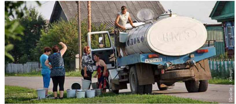
Abholung des täglichen Milchertrags – Subsistenzwirtschaft in entlegenen Dörfern.

Für die Landwirte aus der Region Tjumen kommt das deutsch-russische Forschungsprojekt derweil zur rechten Zeit. Für viele, berichtet Hölzel von Gesprächen vor Ort, sei die Bodendegradation ein ernstes Problem. Zudem spürten die Betriebe erste Auswirkungen des Klimawandels, da die Trockenheit zunehme. Insa Kühling, die an der Hochschule Osnabrück arbeitet, erprobt deshalb in einem weiteren Teilprojekt von SASCHA zusammen mit landwirtschaftlichen Betrieben vor Ort, wie sich unterschiedliche Anbautechniken auf die Bodenfruchtbarkeit