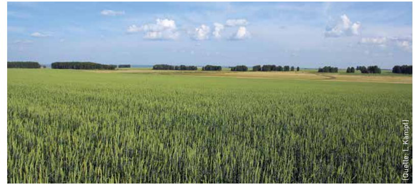
Weizenfelder soweit das Auge reicht.