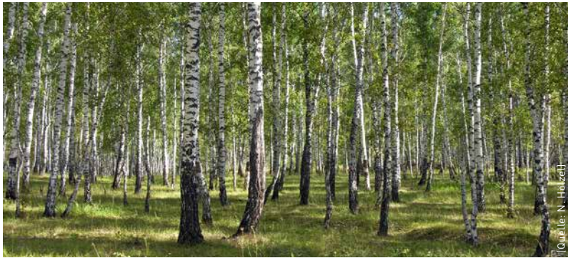
Sibirisches Birkenwäldchen in der Waldsteppe (Sommer).