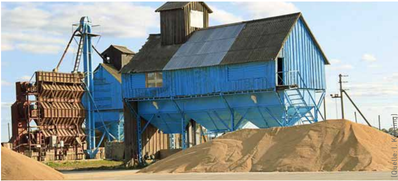
Getreidetrocknung – oft der limitierende Faktor während der Erntearbeiten.

»Durch dichtere Reihenabstände, bodenschonendere Arbeitsweisen oder mehr Düngung lassen sich die Erträge noch erhöhen«, sagt er. Dass eine Ausweitung auf ökologisch wertvolles Grünland auch wirtschaftlich wenig Sinn macht, gilt es nun für die Experten wissenschaftlich zu belegen. »Ziel ist, anhand der Biodiversität, des Wasserhaushalts oder der Speicherung von Kohlenstoff planerisch bewerten zu können, auf welchen Flächen eine ackerbauliche Nutzung ökologisch Sinn macht«, sagt Hölzel. Ein Modell, das sich seiner Meinung nach auch gut auf andere kontinentale Steppenregionen in China, der Mongolei, Sibirien oder Kasachstan übertragen lässt.