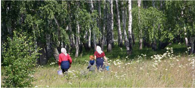
Walderdbeeren werden in der Waldsteppe eimerweise gesammelt, wie hier bei Ishim.