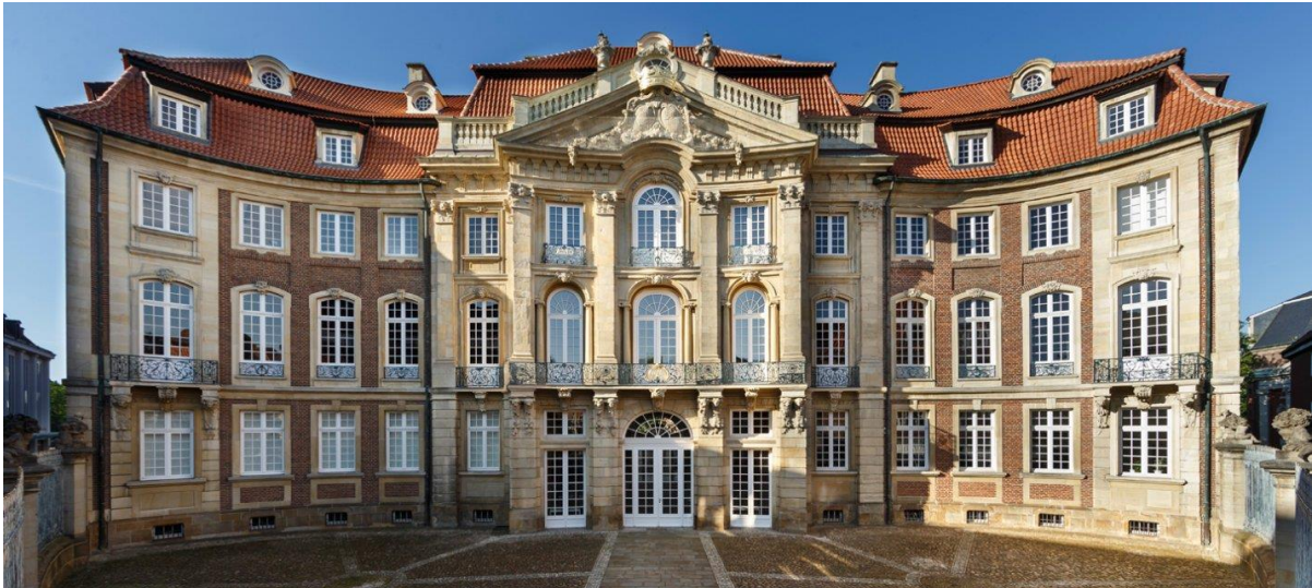
Schauplatz der Eröffnung und des 40-jährigen Jubiläums des Freiherr-vom-Stein-Instituts: Der Erbdrostenhof in Münster

Im Anschluss an die Diskussion bedankte sich Dr. Klein bei allen Teilnehmerinnen und Teilnehmern für den konstruktiven fachlichen Austausch. Im Foyer des Erbdrostenhofs ließen die Gäste die Veranstaltung bei einem Sektempfang ausklingen und verbanden dies mit weiteren Diskussionen in kleineren Gruppen sowohl zum Thema der Veranstaltung als auch zu Erfahrungen aus vier Jahrzehnten Geschichte des Freiherr-vom-Stein-Instituts an der Westfälischen Wilhelms-Universität Münster.