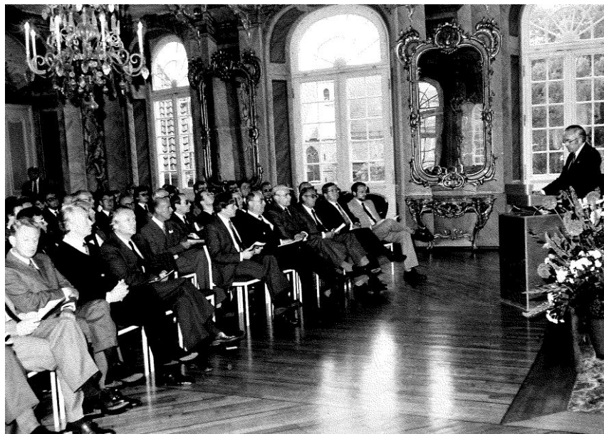
Die Eröffnungsveranstaltung des Freiherr-vom-Stein-Instituts 1981

Eildienst LKT NW Nr. 15/81/97 – 0002-0 –