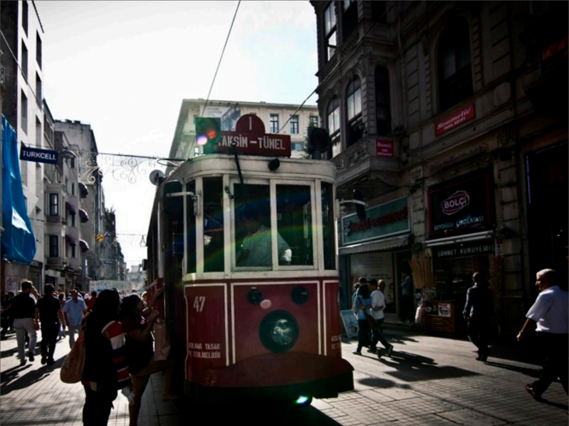
Mittwoch, 4. Dezember 13