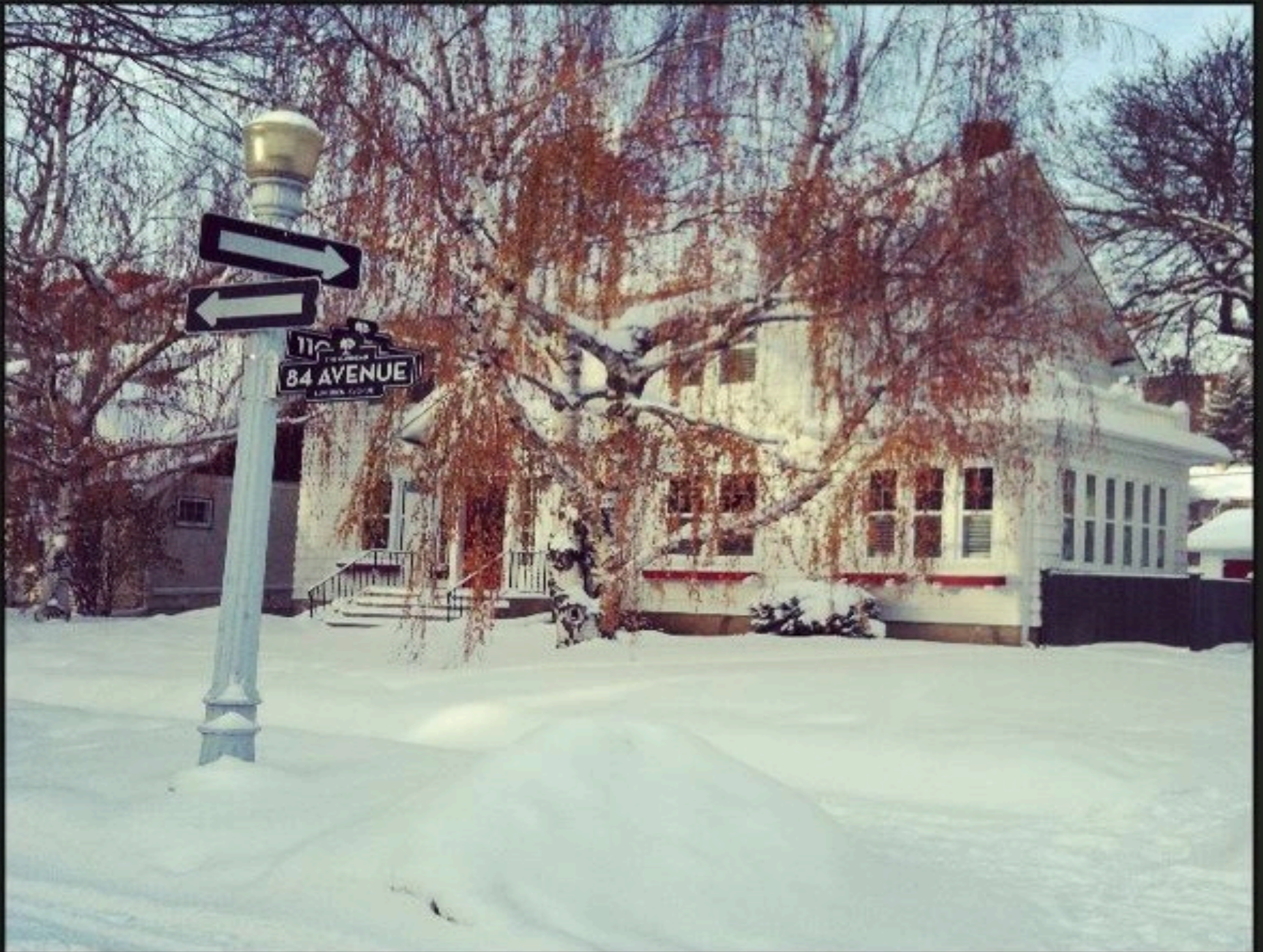
Mittwoch, 4. Dezember 13