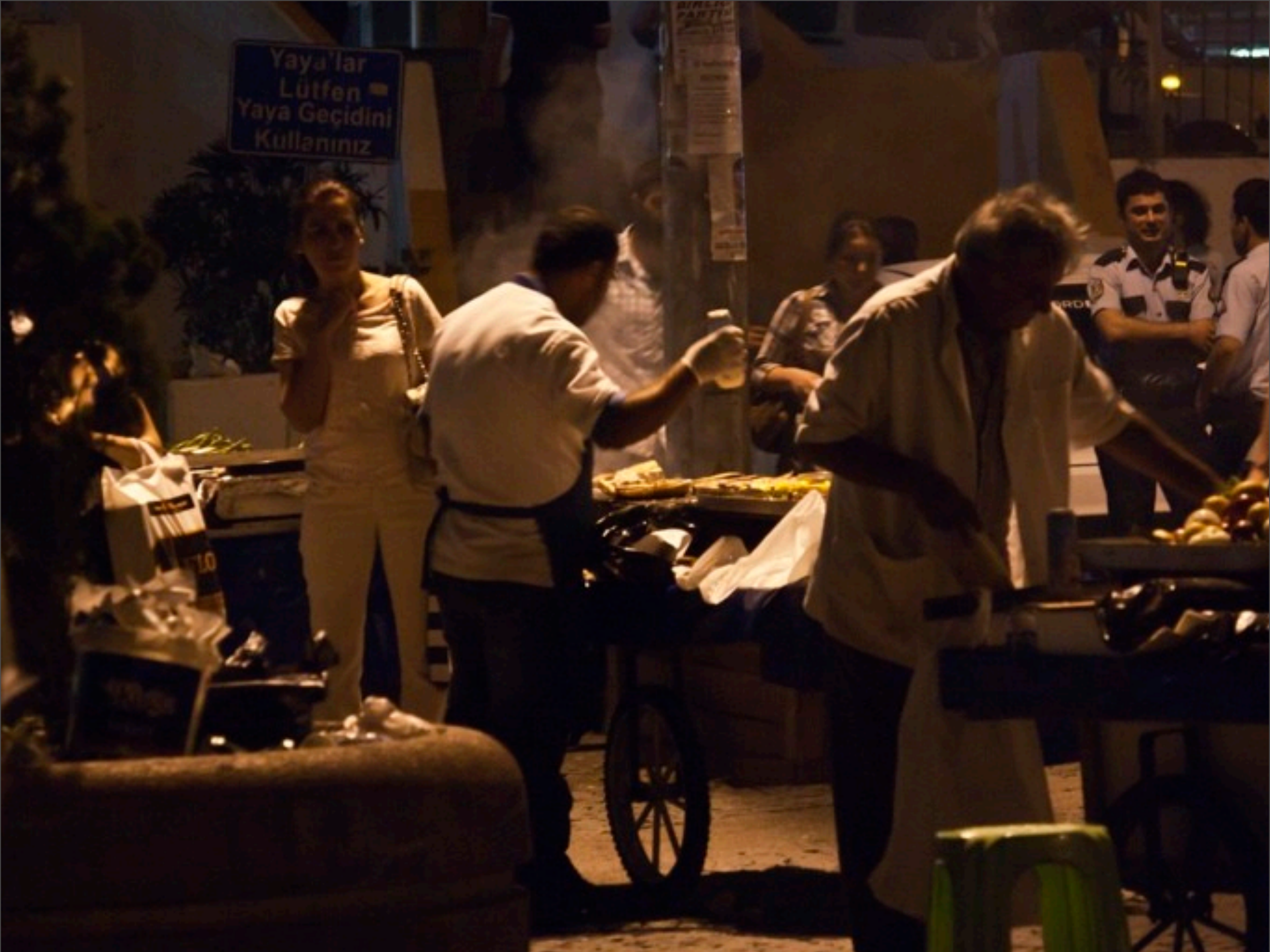
Mittwoch, 4. Dezember 13