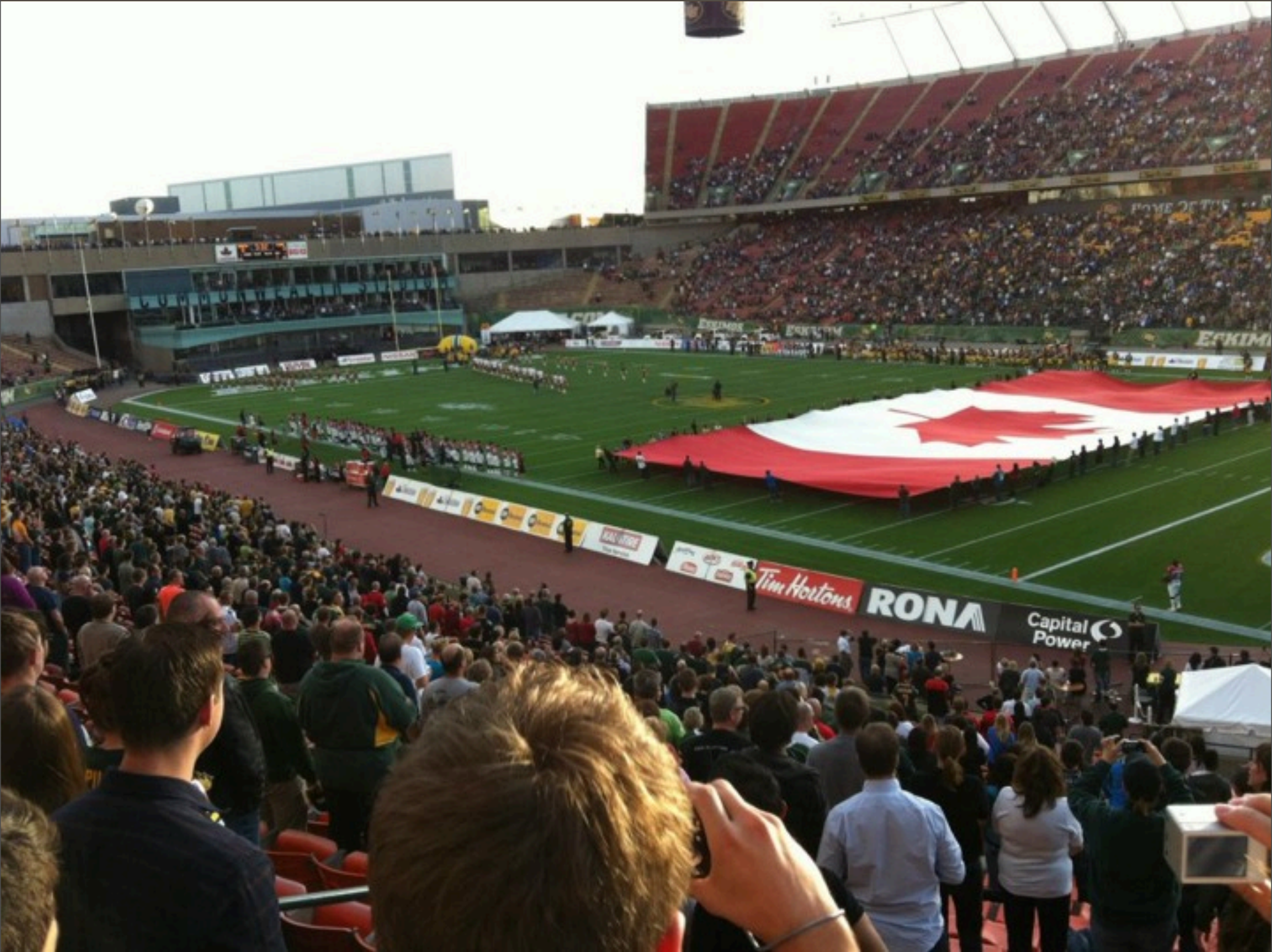
Mittwoch, 4. Dezember 13