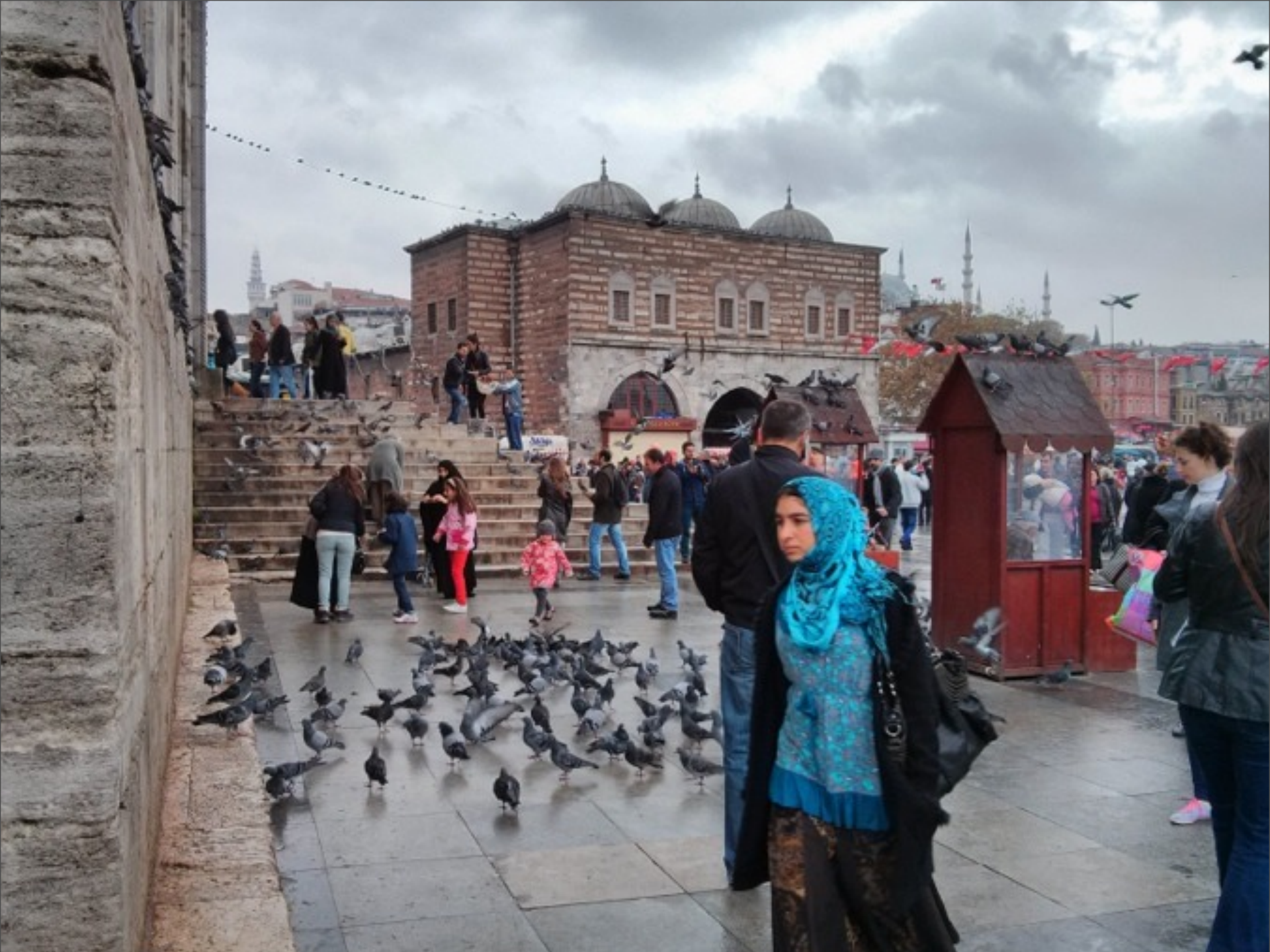
Mittwoch, 4. Dezember 13