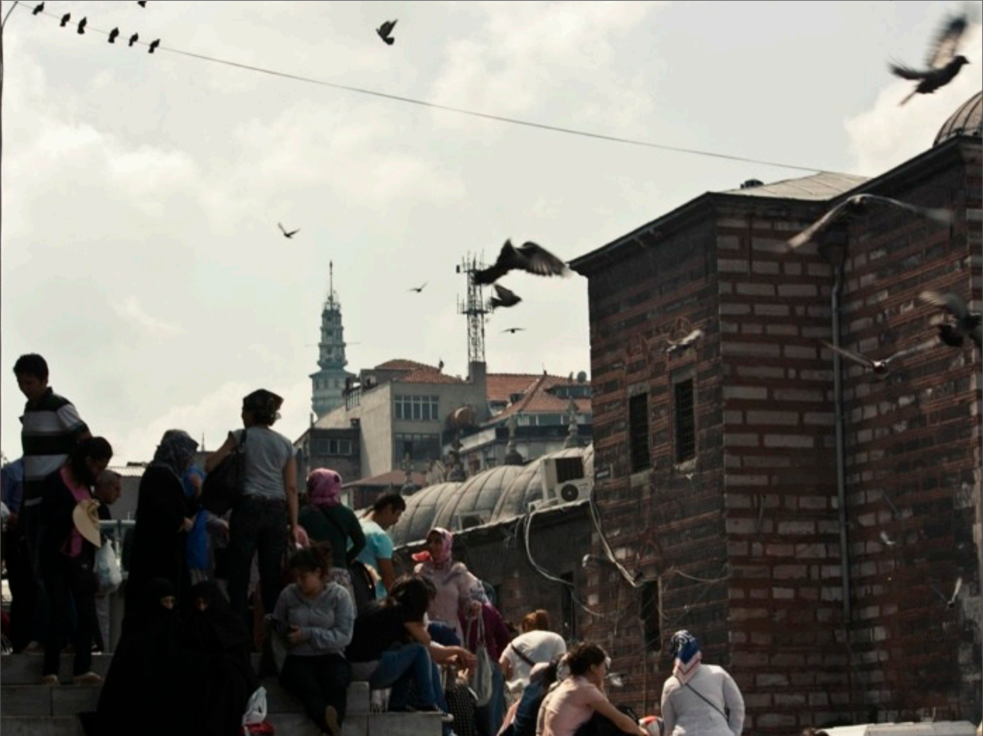
Mittwoch, 4. Dezember 13