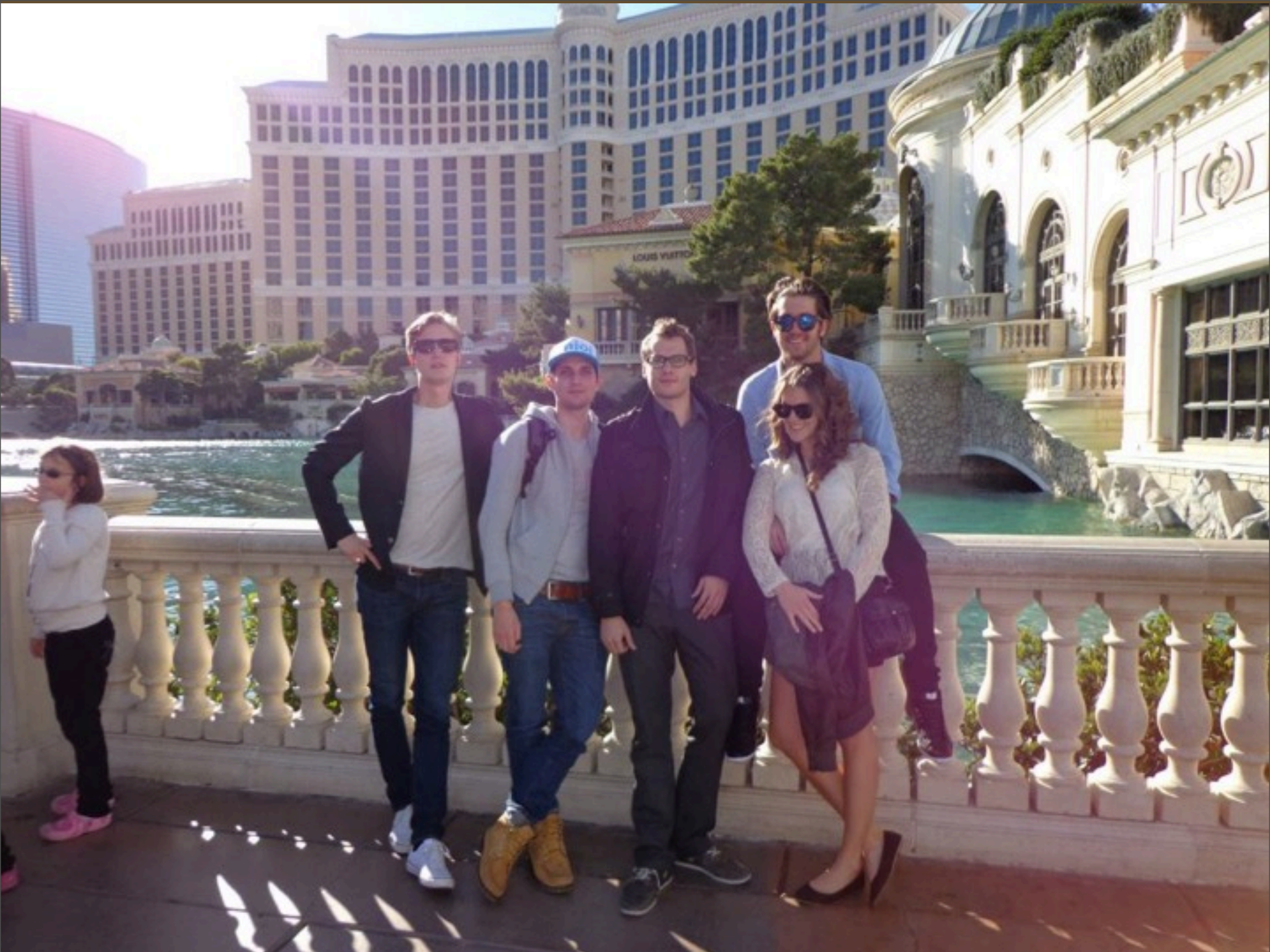
Mittwoch, 4. Dezember 13